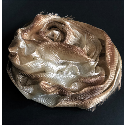
Görsel 3: Nesrin ÖNLÜ, “Spiral”(Spiral), 2018, cam elyafı, dokuma, karışık teknik, 20x20x7 cm, 6th Triennial of Textile Art International Triennial of Miniature Textiles, Hungary