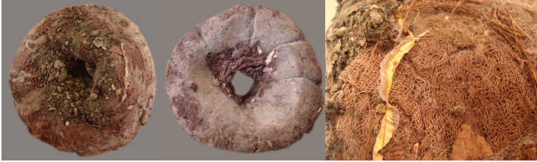
Görsel 11: Gülşen Şefika BERBER, “Bussola”(Pusula), 2009, yün elyafı, sargı bezi, odun talaşı, toprak, keçeleştirme ve kişisel teknik, 20x20x15 cm, 19th International Exhibition of Contemporary Textile Art, Como Miniartextile, Como, İtalya.

Sanatçının “Bussola”(Pusula) isimli eseri, 2009 yılında Como, İtalya’da, 19th International Exhibition of Contemporary Textile Art, Como miniartextile sergisinde, 20x20x15cm, cm boyutlarıyla sergilenmiştir ve kalıcı sergi koleksiyonlarına dahil edilmiştir.