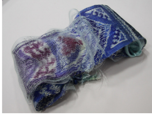
Görsel 2: Günay Aykaç Atalayer, In Anatolia “The Goddess Wears” (Tanrıçalar Giyer), 2017, ipek, polyamid, ikat dokuma, 17×30×8cm, Scythia, the 8-th International Biennial of Mini Textile Art, Ukraine.