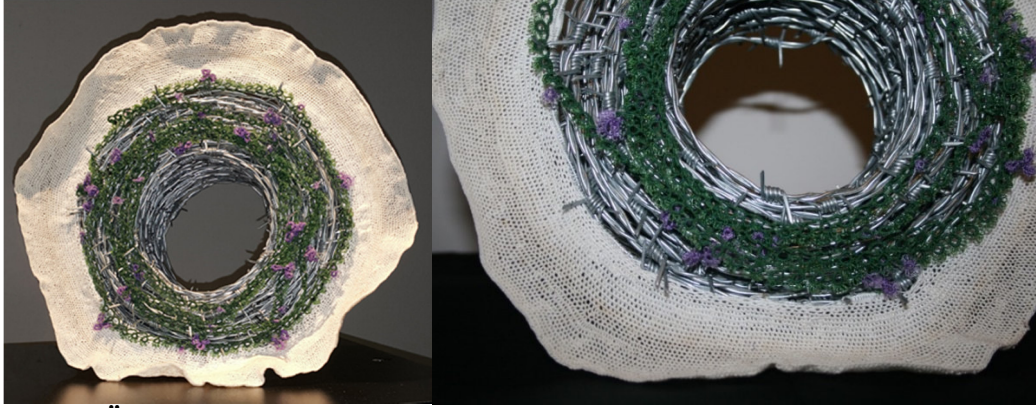
Görsel 7: Leyla Ögüt (Yıldırım), “Suffering”(Çile), 2016, tel, pamuk ipliği, dantel ve tığ işi, Ø 30 cm, Scythia, the 8-th International Biennial of Mini Textile Art, Ukraine

Sanatçının “ Suffering ”(Çile) isimli eseri, 2017 yılında Ukrayna’da Scythia, the 8-th International Biennial of Mini Textile Art, Bienal’inde, Ø 30 cm boyutlarıyla sergilenmiştir.