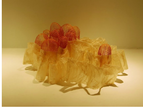
Görsel 8: Öznur Enes, “Depth” (Derinlik), 2008, bağırsak, tel, özgün teknik, enstalasyon 5x30x20cm, International Exhibition of Contemporary Textile Art Miniartextile Como, Italy,