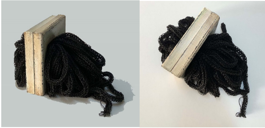
Görsel 6: Selda Kozbekçi Ayrarpınar ,“ Black”(Siyah), 2018, mumlu ip, ağaç çerçeve, karma teknik, 20x16x13,5 cm, 6th Triennial of Textile Art International Triennial of Miniature Textiles, Hungary.

Sanatçının “Black”(Siyah) isimli eseri, 2018 yılında Macaristan’da gerçekleştirilen 6th Triennial of Textile Art International Triennial of Miniature Textiles Bienal’inde 20x16x13,5 cm boyutlarıyla sergilenmiştir.