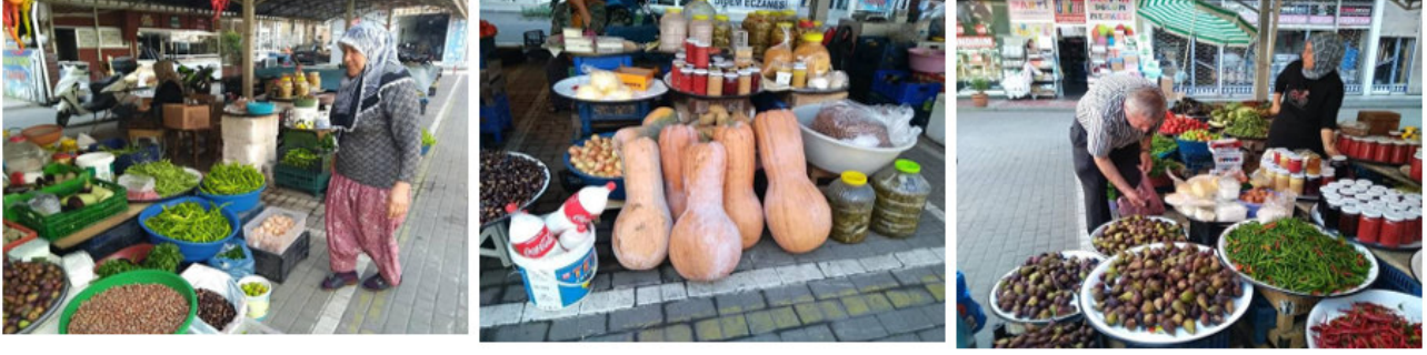
Şekil 4: Alaplı Tarihi Kadınlar Pazarından Görüntüler

Alaplı Ticaret ve Sanayi Odası (2021) 2020-2023 Stratejik Planında şehrin güçlü ve zayıf yönlerinin analizi yapılırken; kadın ve genç girişimcilere yönelik çalışmaların az olması şehrin zayıflığı olarak nitelendirilmiştir. Bu etkinliklerin artırılması stratejik amaç olarak belirtilmektedir. Bunun için eğitim programları hazırlanması, teknik geziler düzenlenmesi planlanmaktadır. Kadın girişimcilerin katılabileceği fuarlara katılımın teşvik edilmesine dikkat çekilmektedir. Kadınlar Pazarı'nın devamlılığı da şehrin konu üzerine hassasiyetinin göstergesi sayılabilmektedir.