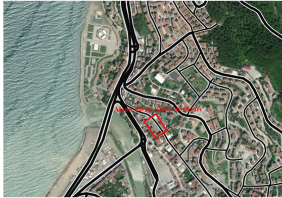
Şekil 1: Alaplı Tarihi Kadınlar Pazarı'nın Kent Merkezindeki Konumu

Alaplı'da kent pazarı çarşamba günleri kurulmaktadır. Şehir içinde kurulan pazar 2007 yılında yeni yapılan kapalı pazar yerine taşınca tarihi kadınlar pazarının kurulmasında bir dönem sıkıntı yaşanmıştır. Kısa bir süre sonra tarihi kadınlar pazarının kent kültürü açısından değer taşıdığına dikkat çekilmiş ve geçmişten bugüne kurulduğu merkezi yerine geri döndürülmüştür. Eski yerine geçiş sürecinde pazarın fiziki koşulları belediye tarafından iyileştirilmiş; yaklaşık 880 metrekare alanda üstü kapalı ve daha koruyucu bir fonksiyona sahip olmuştur. Şekil 2'de kadınlar pazarının güncel halinin projelendirilmesi görülmektedir.