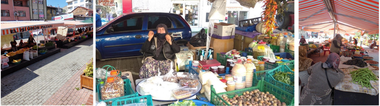
Şekil 5: Tarihi Alaplı Kadınlar Pazarı Genel Görünüm

Zonguldak’ın Alaplı ilçesinde bulunan “Tarihi Kadınlar Pazarı” toplumsal cinsiyet eşitliğine katkı sağlayabilmek adına kentsel kültür olarak yapılan uygulamalardan biridir. Toplumsal cinsiyet eşitliğine duyarlı olmak; adalet ve hak arayışında cinsiyet temelli eşitsizliklerin önüne geçebilecek uygulamaları desteklemek anlamını taşımaktadır. Alaplı’daki kadınlar pazarı kentsel kültürel bir değerdir ve kadınların kendi gelirlerini elde etmelerine yardımcı olabilmektedir. Şekil 5’te Alaplı Kadınlar Pazarı’ndan genel bir görünüm yer almaktadır.