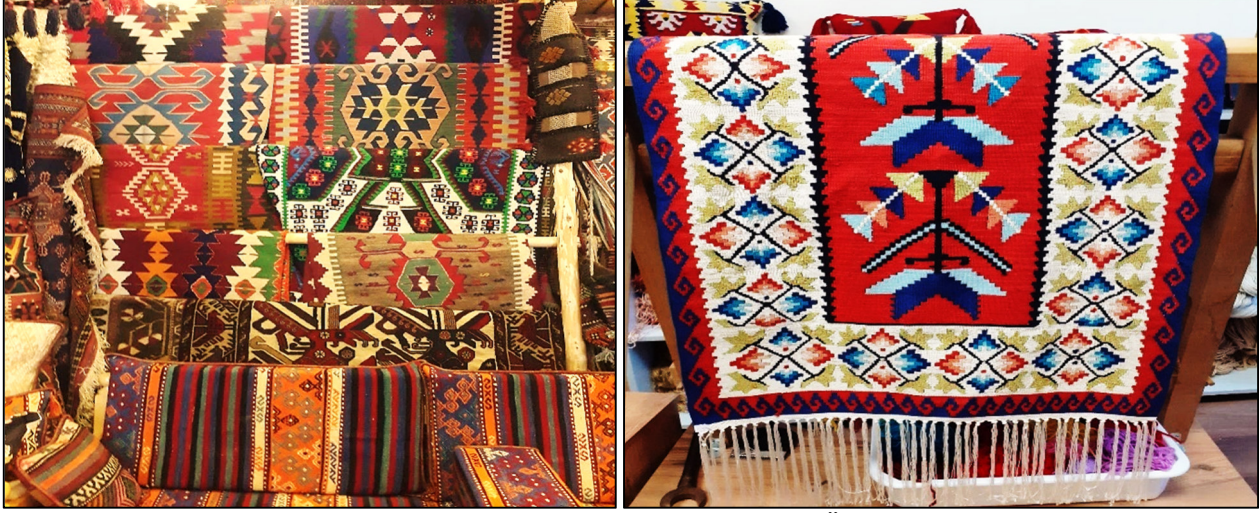
Fotoğraf 1. ve 2. Geleneksel Dokuma Tezgâhlarında Üretilen Antep Kilimleri

Gaziantep'te 1950'li yıllardan önce geleneksel tezgâhlarda dokunan kilimler, 1950'li yıllardan sonra teknik anlamda daha modern tezgâhlarda dokunmaya başlanmıştır. Geçmişten günümüze geçen bu süreçte kilim dokuma sanatı özünü yitirmemiş, motiflerin ve renklerin özgünlüğü bakımından Gaziantep kültürünü itina ile yansıtan geleneksel kilimler dokunmuştur. Ayrıca motorlu tezgâhların yaygınlaşması ve son yıllarda üretimin artması Gaziantep için bu geleneksel el sanatını kıymetli bir sektör haline dönüştürmüştür. Bu nedenle kilim dokuma sanatının taşıdığı kültürel, ekonomik ve sosyal değerler özenle korunarak, kültürel miras turizmi açısından Gaziantep'e ekonomik anlamda bir marka değeri kazandırıp döviz girdilerinin temin edilmesi sağlanabilecektir (URL-2, 2021).