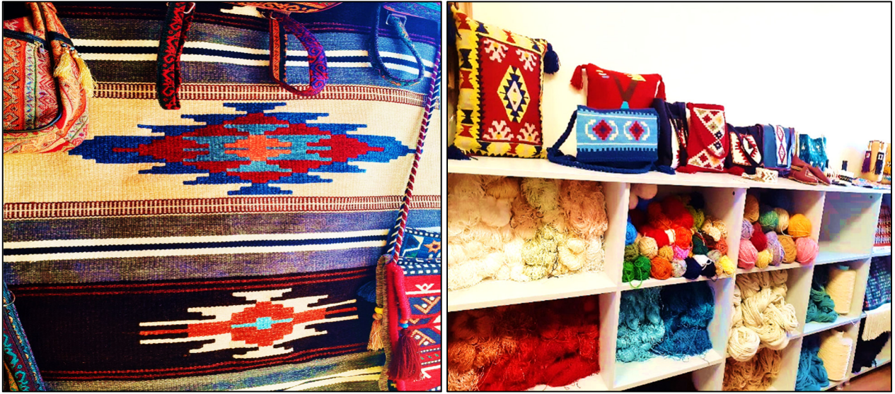
Fotoğraf 3. ve 4. Geleneksel Dokuma Tezgâhlarında Üretilen Kilimler ve Dekoratif Ürünler

Bu nedenle Anadolu kültürünü oluşturan birçok etnik grubun çeşitli kültürel kimlikleri ile yoğrulmuş ve bu çeşitliliğin estetik bolluğunu özümsemiş olan Antep kilimleri kültürel miras turizmi açısından ele alınması gereken değerler arasında yer almaktadır (Oyman, 2019). Dolayısıyla kilimler esas kullanımları dışında farklı anlamlar ve değerler taşıyan turizm varlıklarıdır. Adeta bir renk ve motif cümbüşü halinde dokunan el emeği göz nuru Antep kilimleri günümüzde diğer el sanatlarında olduğu gibi Türk kültürel anlayışının kültür turizmi kapsamında tanıtımında önemli bir dekorasyon malzemesi olarak kullanılmaktadır (Fotoğraf 2). Bu nedenle Gaziantep'te geleneksel kilim dokuma sanatı dâhil olmak üzere birçok kültürel varlığın kültürel miras turizmi açısından değerlendirilmesi ve potansiyelinin ön plana çıkarılması kent için kritik bir katma değer olacağı düşünülmektedir.