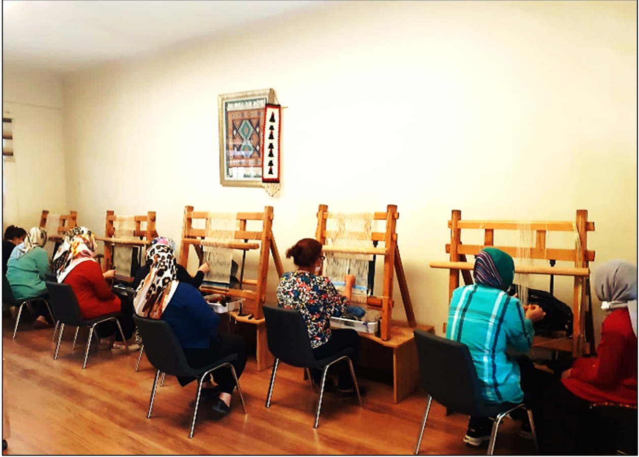
Fotoğraf 7. Gaziantep Geleneksel Kilim Dokuma Sanatı ile Uğraşan Zanaatkârlar