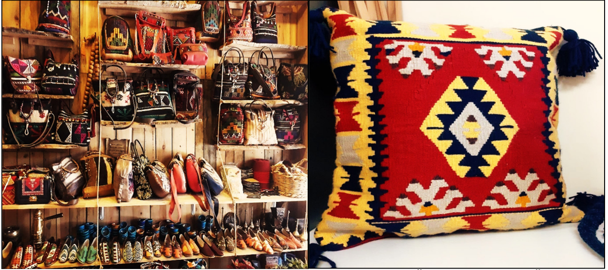
Fotoğraf 5. ve 6. Gaziantep'te Kilim Dokuma Tezgâhlarında Üretilen Dekoratif Ürünler

Araştırma kapsamında elde edilen diğer bir bulgu ise Gaziantep'te üretilen kilimlerin çoğunun hediyelik eşya olarak yurt dışına gönderildiği ve yerel ölçekte kültürel miras turizmi için kent çarşısında, halk eğitim merkezlerinde sergilendiğidir (Fotoğraf 5 ve 6). Ayrıca kilimlerin ve dekoratif amaçlı olarak üretilen ürünlerin Antep kültürünün ulusal ve uluslararası alanda tanıtımında önemli bir kültürel miras olduğu vurgulanmıştır. Katılımcılar Antep kilimlerine yalnızca yurt dışından ve çevre illerden gelen turistler tarafından ilgi gösterildiğine, yerel halkın bu konuda geri planda kaldığına dikkat çekmişlerdir. Katılımcıların çoğunun sorulara verdikleri cevaplar doğrultusunda bu mesleği icra etmekten memnun olduğu ve ürettikleri geleneksel kilimlere olan talep ve ilgi arttığı sürece daha mutlu olacakları ve gayretle çalışacakları gözlemlenmiştir (Tablo 5).