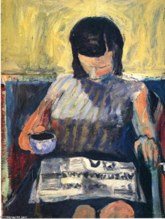
Resim 9. Gazeteli Kadın, 1960 Richard Diebenkorn, Tuval Üzerine Yağlıboya 121,9 x 86 cm, Özel Koleksiyon

Kendi bünyesinde türlere ayrılan gazeteler, içeriklerine ve konularına göre farklılaşmış, böylelikle toplumun her kesiminden insanlara hitap eden gazetecilik anlayışı yaygınlaşmıştır. Artık modern dünyada insanlar fikir-sanat gazeteleri, kadın-çocuk gazeteleri, spor gazeteleri vb. çok sayıda türe sahiptir. Öyle ki bu farklılaşma resim sanatındaki gazete imgeleriyle de kendisine temsil alanı bulmuştur.