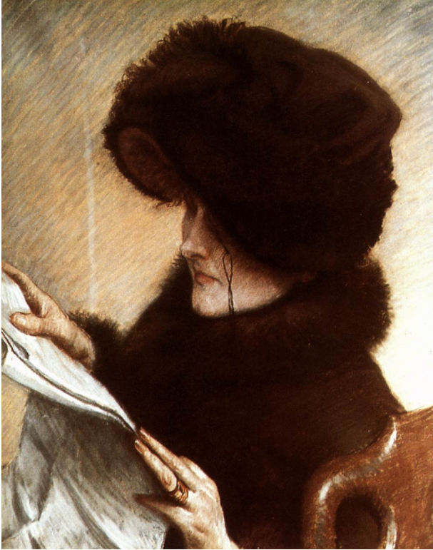
Resim 3. Gazete, 1883

James Tissot, Kâğıt Üzerine Pastel, 63 x 50 cm Musée du Petit Palais, Fransa