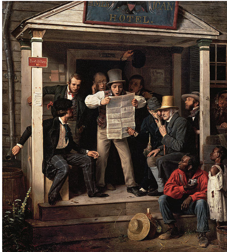
Resim 1. Meksika’dan Savaş Haberleri, 1848

Resimler, sanatsal üretimler olmanın yanı sıra yüzyıllar boyunca birer görsel kitle iletişim aracı olarak da insanlara hizmet etmişlerdir. Dolayısıyla, bir kitle iletişim aracının bünyesinde yine bir kitle iletişim aracını barındırıyor olmasının bir anlamı olmalıdır. Resim sanatı ve eserlerde bulunan gazete imgelerinin çözümlenebilmesi için öncelikle o eserlerin üretildikleri dönemleri ve söz konusu dönemlerin sosyal, kültürel, siyasi, askeri ve ekonomik bağlamlarını anlamak gerekmektedir. Bu nedenle gazete imgeleri içeren resim sanatından örneklere kronolojik olarak yer verilecektir.