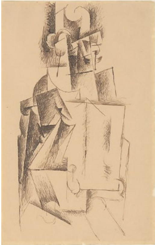
Resim 7. Oturan, Gazete Okuyan Adam, 1912 Pablo Picasso, Kâğıt Üzerine Mürekkep 30,8 x 19,7 cm, MET Museum, ABD

Formu bozulmuş, fovist ve kübist tarzdaki bu eserlerde gazete imgelerinin yer alması, 20. yüzyılın ilk çeyreğinde gazetelerin kişiler ve toplumlar üzerindeki yönlendirici etkisini ifade etmektedir. Çünkü bu dönemde I. Dünya Savaşı'na zemin hazırlayan emperyalist politikalar ve milliyetçi eğilimler konusunda kitleleri etkileme, onları yönlendirme ve ikna etme görevlerini siyasetçilerle birlikte gazetelerin üstlendiği söylenebilir. Bu nedenle bireyleri ve toplumları gazete okumak ve gazete okumaya yönlendirmek için sanat eserlerinde gazete imgelerine yer verildiği; sanat eserleri aracılığıyla, gazete okumanın kültürel ve entelektüel bir sermayeye sahip olmak için başvurulmuş bir kaynak olarak gösterildiği ifade edilebilir. Dolayısıyla gazete imgelerinin resim sanatındaki yansımaları ve misyonu yalnızca gazete okuyan kadın ya da erkek figürler üzerinden değil aynı zamanda eğitim sürecinde olan öğrenciler üzerinden de tanımlanmaktadır.