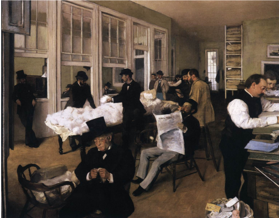
Resim 2. New Orleans Pamuk Borsası, 1873 Edgar Degas, Tuval Üzerine Yağlıboya, 73 x 92 cm Musée des Beaux-Arts de Pau, Fransa

New Orleans'daki bir pamuk borsasını konu alan ikinci resimde ise, pamukların kalitesini kontrol eden ve evrak işleri ile ilgilenen çok sayıda figür yer almaktadır. Ancak Edgar Degas bu eserin merkezine fazlasıyla rahat bir şekilde oturan ve gazete okuyan bir figür yerleştirmiştir. 19. yüzyıla ait olan resimde, merkezde yer alan gazete imgesi, onu okuyan figürün beden diliyle birlikte şüphesiz bir anlam ifade etmektedir. 19. yüzyıl Batı dünyasında haritaların yeniden çizilmesine sebep olan çok sayıda siyasi ve askeri değişikliğin yaşandığı bir dönemdir. Batı dünyası 17. yüzyılda yapılan coğrafi keşifler ve 18. yüzyılda gerçekleşen Sanayi Devrimi'nin neticesinde ucuz ham madde, işgücü ve yeni pazar arayışı ile farklı coğrafyalara uzanmış ve ekonomik temelli bir dönüşüme girmiştir. Aynı zamanda 18. yüzyılda yaşanan Fransız Devrimi, milliyetçilik ideolojisini ön plana çıkararak Batı dünyasında hızla yayılmasına sebep olmuş ve büyük imparatorluklar dağılarak yerlerini ulus devletlere bırakmıştır. 19. yüzyıl yaşanan tüm bu değişim ve dönüşümlere bağlı olarak gerek sosyal ve kültürel gerekse ekonomik açıdan emperyalist politikaların hâkim olduğu bir dönem olarak dikkati çekmektedir. Bu kadar yoğun hareketliliğin yaşandığı bir dönemde, gazetelerin ne kadar büyük bir önem arz ettiği ise tartışılmaz bir unsur olarak karşımıza çıkmaktadır.