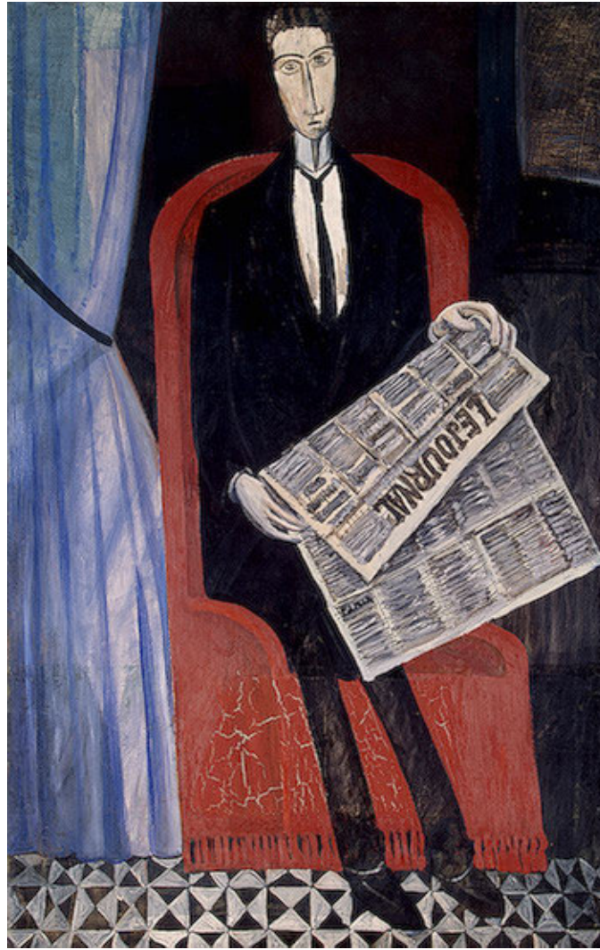
Resim 6. Gazete Okuyan, Bilinmeyen Bir Adamin Portresi, 1911-14 André Derain, Tuval Üzerine Yağlıboya, 162,5 x 97,5 cm Hermitage Museum, Rusya

20. yüzyılla birlikte dünyada yaşanan askeri, siyasi, sosyal, kültürel, ekonomik ve teknolojik değişimler ve dönüşümler, eğitimin ve enformasyonun daha ulaşılabilir hale gelmesine zemin hazırlamıştır. Özellikle iletişimin kitleler üzerindeki etkisinin ve öneminin daha da ön plana çıktığı bu süreçte sanat ve sanatın iletişimsel boyutu da değişikliklere uğramıştır. Formun bozulması, sanatsal üretimlerin belli kural ve kalıplardan arınarak daha özgür olması, sanat eserlerinin verdiği mesajlara da yansımıştır. Toplumsal dinamiklere bağlı olarak dönüşen bu yeni sanat anlayışında da figüratif ya da soyut (non-figüratif) resimlere yansıyan gazete imgeleri dikkati çekmektedir.