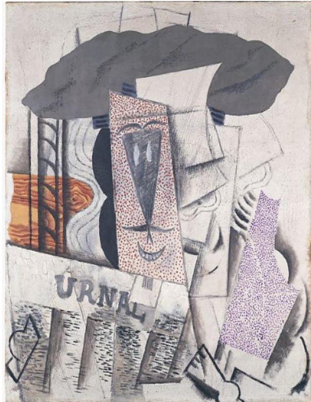
Resim 8. Bir Gazeteye Öğrenci, 1913-14 Pablo Picasso, Tuval Üzerine Alçı, Yağlıboya, Pastel Boya ve Kum, 73 x 59,7 cm, MET Museum, ABD

Gazete sözcüğü ya da gazete imgesi, gazetecilik alanı ya da mesleği 19. yüzyılla birlikte kavuştuğu yeni çehresiyle modern toplumların vazgeçilmez bir parçası olmuş ve birincil haber alma kaynağı haline gelmiştir. Radyo ve televizyon gibi işitsel ve görsel kitle iletişim araçlarına rağmen etkinliğini yitirmeyen gazetelerin önemi II. Dünya Savaşı Dönemi'nde de kendini göstermiş, gazetelerde yer alan makaleler ve köşe yazıları kitleleri yönlendirmede oldukça etkili olmuştur. İlerleyen dönemlerde ise gazeteciliğin ve gazetelerin seçkin bir perspektife sahip olup olmaması ya da bir popüler kültür nesnesi haline dönüşme süreci tartışılmıştır. Bu gazetecilik alanındaki, yüksek kültür ve popüler kültürle ilgili ebedi soruların bir tekrarıdır (Schudson, 2011: 215). Ancak gerçek olan şudur ki, gazetecilik alanı zaman içerisinde, toplumsal dönüşümlere bağlı olarak kendi hedef kitlesini belirlemiş ve gazeteler de yalnızca haber verme araçları olmaktan uzaklaşmışlardır.