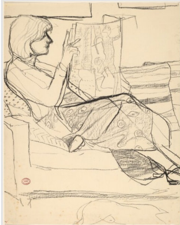
Resim 10. İsimli (Gazete Okuyan Kadın), 1955-67 Richard Diebenkorn, Dokuma Kağıt (Wove Paper) Üzerine Siyah Pastel Boya, 63,8 x 50,7 cm Washington, ABD

Sanat alanında özellikle II. Dünya Savaşı sonrası dünyayı saran savaş karşıtı özgürlükçü anlayışla, insanların bireysel hakları, milletlerin ve etnik kimliklerin ötekileştirilmemesi, cinsel kimliklerin özgür ifadesi ve feminizm gibi çok sayıda düşünsel unsurun ön plana çıktığı bilinmektedir. Bu dönemde sanat eserlerinin de konu ya da performans olarak bu düşün hareketlerinden beslendiği ve kavramlardan hareketle yalnızca eser üretmenin yanı sıra yapılan sanat performansları da dikkati çekmektedir. Figüratif sanat anlayışında üretilen ve gazete imgesi ile tamamlanan kadın figürlerin yer aldığı son iki resimde de ait oldukları dönemin anlayışı ve dinamikleri açıkça görülmektedir. Bu resimlerde yer alan gazete imgeleri kadının toplumdaki konumunun ve rolünün altını çizerken, onun özgür ve rahat hayatını da feminist bir perspektiften izleyiciye sunmaktadır. Okunan gazetelerin modern hayatın farklı okuyucu kitlelerine hitap ettiği, bir gazetenin günlük haber gazetesi diğerinin ise resimli bir magazin gazetesi olduğu anlaşılmaktadır. Bu noktada söz konusu gazete imgelerinin ve 19. yüzyılda gazete okuyan kadın figürlerle 20. yüzyılda gazete okuyan kadın figürler arasındaki farkın net olarak anlaşılabilirliği düşünülmektedir.