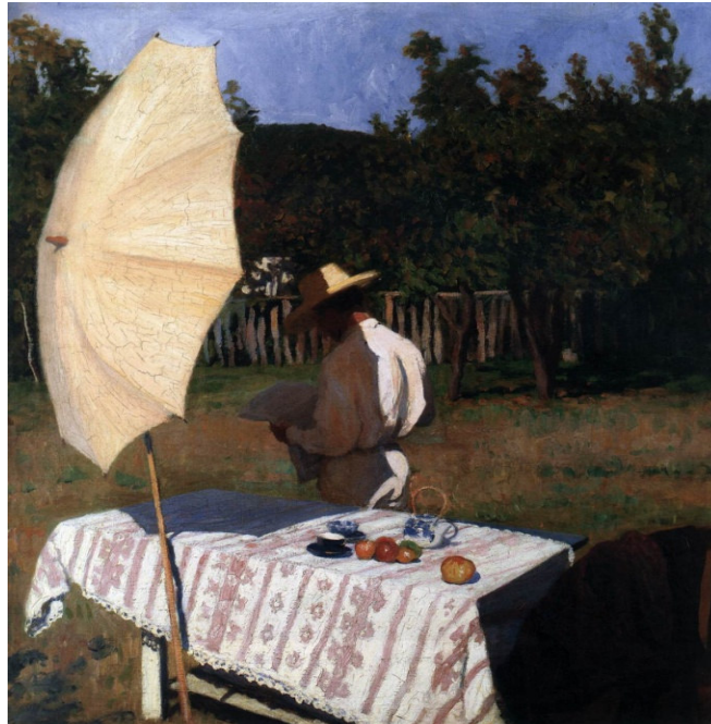
Resim 5. Ekim, 1903

Gazetecilik tarihinde 20. yüzyıla gelindiğinde ise farklı bir gazete formatı olan tabloidlerin kullanıldığı görülmektedir. Tabloidler, küçük boyutta düzenli olarak çıkan gazetelerdir. Sayfa sayılarının az olması, kolay erişime sahip olmaları, kısa zamanda okunup tüketilmeleri, resimler ve çarpıcı başlıklarla haberlerin sunulması, tabloid basını ciddi/fikir gazetelerinin (prestige press) alternatifine getirmiştir (İnal, 2010: 163). Ekonomik olması ve hızla okunup el değiştirmesi bakımından Avrupa ve ABD’de hızla yaygınlaşan tabloid gazetecilik anlayışı, orta sınıf olarak değerlendirilen sosyal sınıfa hitap etmesi açısından da önem arz etmektedir. Tabloid gazetelere erişimin kolay ve ucuz olması, çok daha fazla sayıda kişinin gazete almasına ve okumasına olanak vermiş, bu durum sanat eserlerinde de kendisine yer bulmuştur.