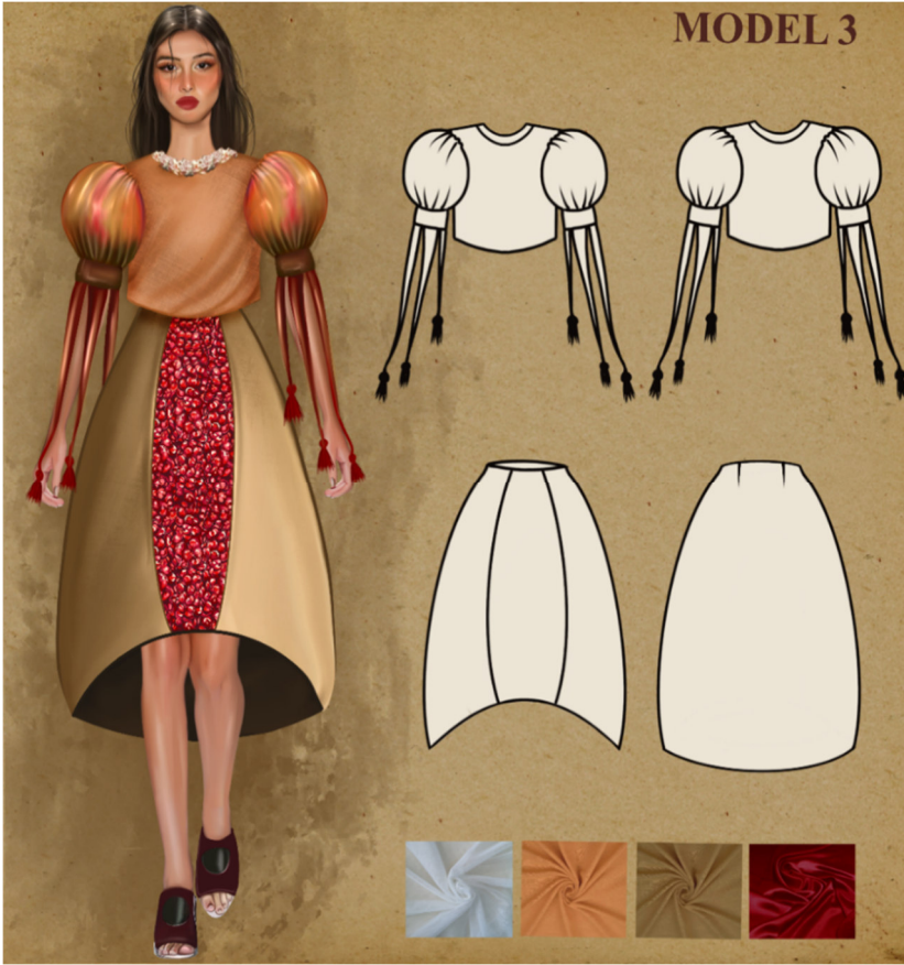
Çizim 5: Model 3 Paftası