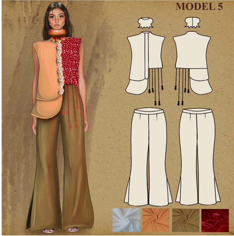
Çizim 7: Model 5 Paftası