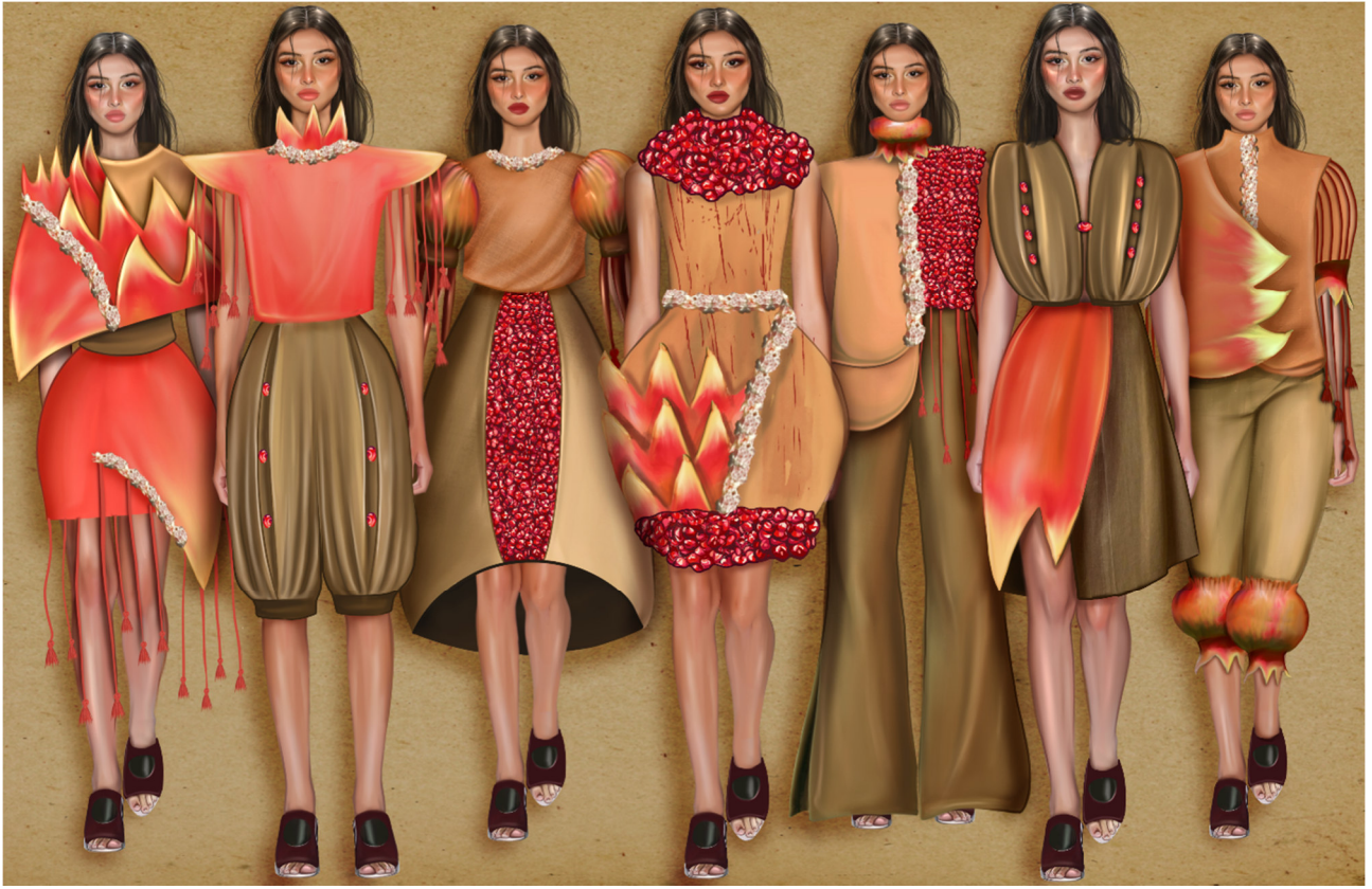
Çizim 1: Nar Motifli Giysilerin Genel Görünümü

Her toplumun kendine özgü mitolojileri, mitleri, efsaneleri, hikayeleri vardır ve bu mitler temsil ettiği topluluğun kültürünü yansıtır. Mitolojiler toplumdan topluma yaşam şekline göre farklılıklar gösterebildiği gibi insanoğlunun duygularının dünyanın neresinde olursa olsun ortaklıklar göstermesinden dolayı benzerliklerde bulunmaktadır (Akman, Köktan, 2019: 223). Nar motifi ile ilgili mitolojilerde ise bereket, üreme, doğurganlık, güç, saltanat, aşk gibi güzel anlamlar mevcuttur. Nar güzeldir, şifalıdır ve güzelliklerin temsilidir. Güzel anlamlara ve güzelliklere sahip nar motifi, giysi tasarımlarına ilham kaynağı olmuştur. Geçmişten Günümüze Nardan Esintiler isimli koleksiyon, 2022-2023 ilkbahar-yaz kreasyonuna uygun kadın giysileri olarak tasarlanmıştır. Feminin stilde, özel günler için tasarım önerileri sunulmuştur. Pamuklu, saten kumaş, tül, püskül,elyaf kullanılan malzemeler arasındadır. Dok tela kullanılarak sert doku oluşturulmuştur. Yeşil, sarı, kırmızı, beyaz renkler kullanılmıştır.