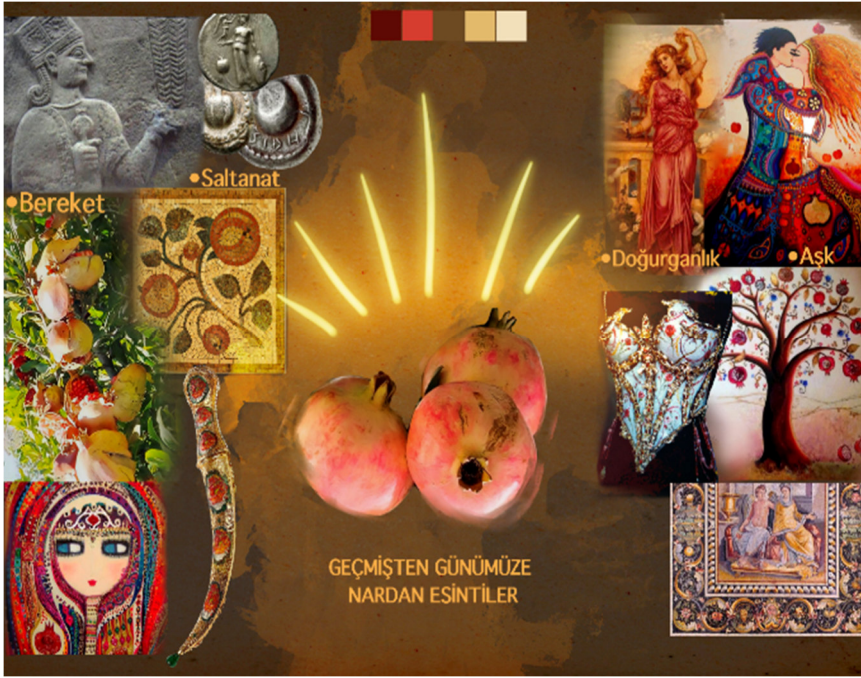
Çizim 2: Hikaye panosu