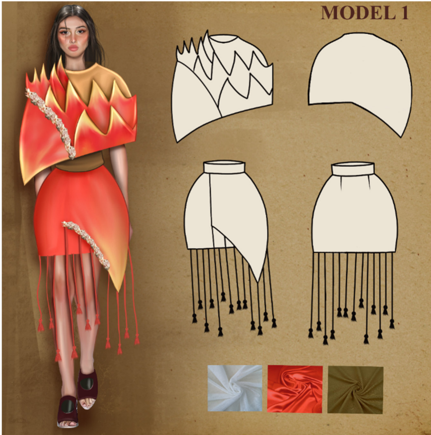
Çizim 3: Model 1 Paftası

Tasarımın ilk aşaması olan hikaye panosu için nar motifi ve ikonografisini anımsatan materyaller tespit edilmiştir. Materyaller procreate programında düzenlenmiş, hikaye panosunun başlığı ve ilham veren anahtar kelimeler panoya yerleştirilmiştir. Böylece tasarım için ilham kaynağı, araştırmanın sanatsal olarak bir araya getirildiği tablo hazırlanmıştır. Hikaye panosu ve araştırma sonucunda zihinde oluşan olgulara yoğunlaşarak 7 model pafta halinde sunulmuştur.