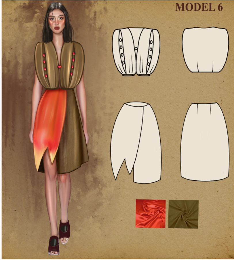
Çizim 8: Model 6 Paftası