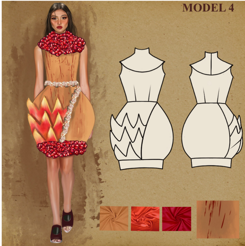
Çizim 6: Model 4 Paftası

Model etek, bluz olarak 2 parçadan oluşmaktadır. Pamuklu kumaştan düşünülen bluz, oyuntulu yuvarlak yakalı, kısa kollu tasarlanmıştır. Yakada nar tanelerini birbirinden ayıran zar, büzgülü tüllerden yapılarak, üç boyutlu düşünülmüştür. Kollarda, mevki ve unvan yazılı olan tirazlardan ilham alınarak nar motifleri üsluplaştırılarak kullanılmıştır. Etek pamuklu kumaştan tasarlanmıştır. Ön ortasında çatlayan nar görüntüsü verilmek istenmiştir. Uzak doğuda narın çatlayarak açılmasının yüzlerce çocuk doğacağına olan inançtan esinlenilerek eteğin ön ortasında yapılan nar taneleri saten kumaşın içinin elyafla doldurulup dikilmesi ve üst üste getirilmesi ile oluşturulmuştur.