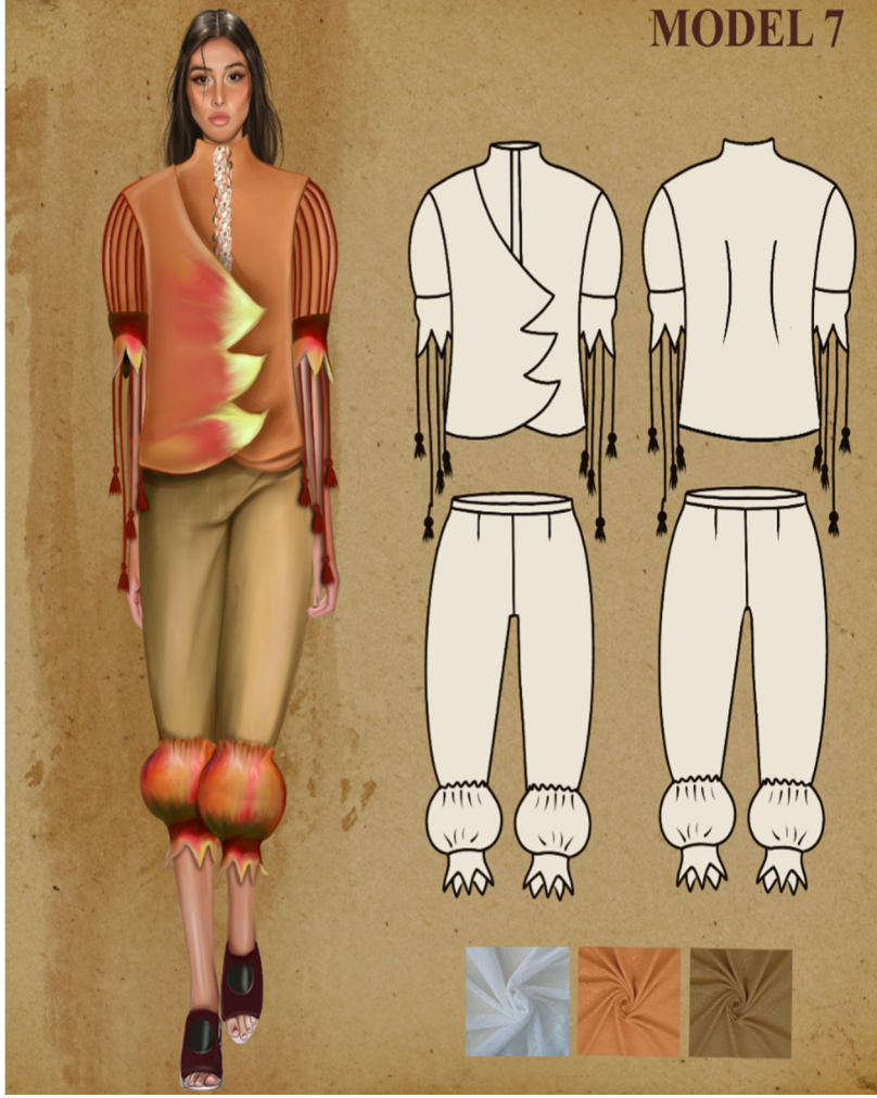
Çizim 9: Model 7 Paftası