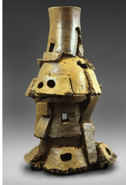
Resim 3. Peter Voulkos, Notre Dame, 2001, Snite Museum of Art.

Diğer disiplinler gerek teknolojik yeniliklerle ortaya çıkan malzemeler gerekse değişen medyumlarla üretimlerinde farklı biçim varyasyonlarına ve bu bağlamda içerikte anlam dönüşümlerine ulaşabilmişlerdir. Seramik teknolojisi düşünüldüğünde elbette tabiatı gereği biçim yaratımında yenileyebileceği, ekleyebileceği ya da uzlaşabileceği herhangi bir yeni materyal olamaz; kaldı ki genel anlamda elbette seramik üretiminin böyle bir zorunluluğu da yoktur. Fakat Voulkos, Arneson, Frey gibi A.B.D.'de “yeni seramik sanatı” mefhumunun yaratılması adına oluşturdukları seramiğin geleneksel dilden ve okumadan sıyrılması, zanaatın güzel sanatlara dönüşümüne yaptıkları katkılar tümüyle biçim üzerine odaklanmaktadır.