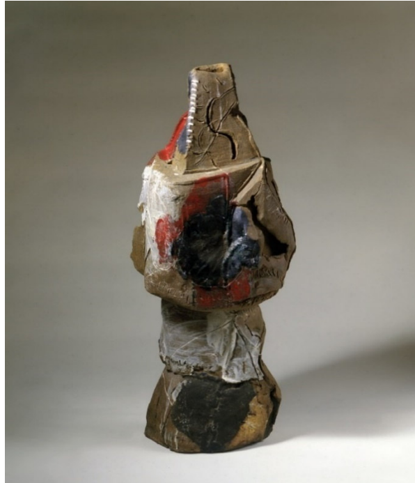
Resim 5. Peter Voulkos, kızıl nehir, 1960, Whitney Museum of American Art, New York.

Voulkos biçim anlayışının etkisi olarak basit kap formunu dönüştürdüğü yeni objeyle kendisini modernizm sonrasında disiplinlerarasılığına konumlandırmıştır. Shiner konu hakkında "Çok geçmeden Voulkos ve onun yolunda gidenler "çömlekçi" veya "zanaatçı" olarak değil "seramik heykeltıraşı" olarak anılmaya başlıyorlardı" der(Slikva 1978, aktaran: Shiner, 2018: 383).(Resim 5)