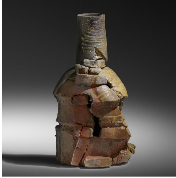
Resim 1. Peter Voukos, Shogun, 1996, Anderson koleksiyonu, Stanford Üniversitesi.