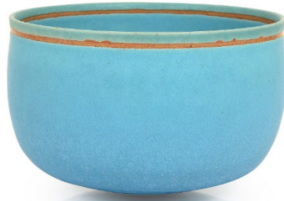
(soldaki) Resim 6. Siyah Kare, 1915, tuval üzerine yağlıboya, 79.5x79.5 cm, Tretyakov Galerisi (sağdaki) Resim 7. Alev Ebuzziya Siesbye, Seramik, 1982, 8x12 cm