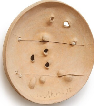
Resim 4. Peter Voulkos, İsimless tabak, 1975, Sotheby's koleksiyonu, New York.

Bu bağlamda Voulkos'un yaptığı yalnızca dışavurumcu müdahale ve sürecin sergilenmesi değil aynı zamanda geleneksel çömlekçilik objelerinin birer temsilidir. Voulkos temsili objeyi ele aldığı yapıbozumsal biçimde yeniden inşa eder; geçmişi olan ya da hali hazırda bilinen işlevsel bir imajı dışlamadan, bizatihi kullanarak yeni bir nesneyle neticelendirir. Bu durumun avangard sanatın modernizm öncesi çizdiği bir çizgiyi takip ettiği değerlendirilebilir. "Avangard sanat geçmişten doğar, önceden var olan sanat anlayışını değiştirir." (Carroll, 1999: 245) (Resim 4)