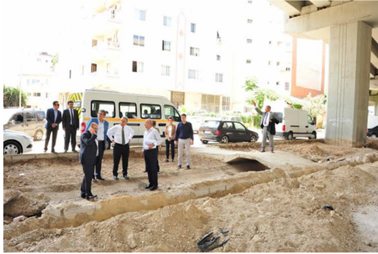
Şekil 1: http://www.hurriyet.com.tr/uckuyular-pazaryeri-bir-ay-sonra-hazir-40057668

Üçkuyular bölgesi feribot, ESHOT, dolmuş, metro ve tramvay için aktarma merkezi olarak çalışan bir bölgedir. 2015 yılında İstinye Park Avm inşaatının başlayacağı, bu sebeple ESHOT ve ilçe dolmuş transfer merkezleri ile beraber Üçkuyular Pazarı’nın da, alanın yeni alışveriş merkezine ev sahipliği yapması sebebiyle, çevre yolu viyadüğünün altına taşınması uygun görüldü. Kentli hakkının (kullanıcı ya da pazarcı) gözardı edilerek otoritelerce alınan bu karar ile pazar alanının tamamının en yakın aktarma merkezine 12 dk yürüme mesafesindeki alana taşınması için çalışmalar başlamış oldu. (Şekil 1)