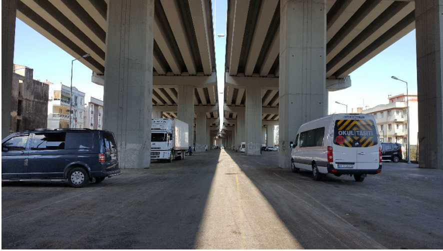
Şekil 5: Yeni Pazar alanının haftaiçi kullanımı (Gelişkan, Mayıs, 2022)

Viyadükleri, altında kalan mekanları kullanmak için yükseltmediğimiz aşıkardır. Bu denli devasa mekanları üretirken kontrolü elimize alıp almadığımız ise bir soru işaretidir. İzmir’de özellikle çevre yollarının kesiştiği ve bu yolların merkez caddeler ile bağlandığı noktalarda birçok viyadük ile karşılaşmak mümkündür. Bu yüksek viyadüklerin devasa ayakları yaşayanlar tarafından kendilerini sloganlar, posterler ya da grafitilerle ifade etmek için kullanılan birer tuval haline gelir. Üçkuyular’daki viyadükte ise bu kullanıma ek olarak oldukça serin ve güneşsiz bir çocuk parkı ve yürüyüş parkuru ile karşılaşılır(dı). (Şekil 5)