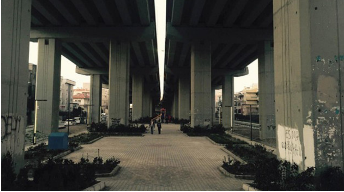
Şekil 2: Pazar yeri olması için rehabilite edilmeden evvel park olarak hizmet veren alan. (Gelişkan, Kasım, 2015)