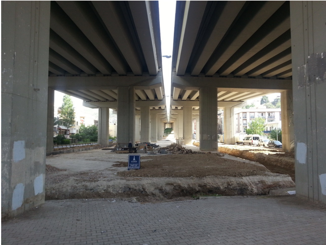
Şekil 3: Pazar alanı olmak üzere alt ve üst yapı çalışmaları yapılan alan (Gelişkan, Mayıs, 2016)