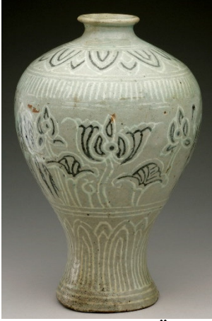
Görsel 5 Buncheong Örneği, 15.yy

Kaynak: www.brooklynmuseum.org/opencollection/objects/167035