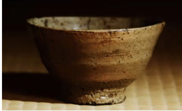
Görsel 9: 16. yüzyıla tarihlenen Buncheong stili Kore Çay Kasesi

Kraliyet mensupları, üst düzey askerler ve zengin toprak sahiplerinin bulunduğu çay seremonileri Japon kültüründe politika, ekonomi ve siyasi yönetimle ilgili her türlü konun konuşulduğu ve planlandığı önemli toplantılardır. Bu toplantılarda kullanılan çay kaselerine ilişkin Japonya'da bulunan 1530'lu yıllara ait Chakaiki olarak adlandırılan çay günlükleri sanat tarihçileri için detaylı bilgiler içeren önemli belgeler niteliğindedir. Bu günlükler, Kore çay kültürünün Japon kültürüne etkileri bağlamında önemli bir rol oynamaktadır. İlk Kore çay kasesi kelimesi 1537 yılına tarihlenen çay hazırlayan ve servis eden bir tüccarın çay günlüğünde rastlanmaktadır (Pitelka, 2022). Teknik ve estetik dönemin en ileri seviyesini ifade eden bu Kore üretimi çay kaselerinin Japon çay seremonilerinde kullanımına dair literatürde iki farklı görüş bulunmaktadır. Bunlardan ilki; Çay Kasesi Savaşları 'ndan önce 1530'lu yıllarda Japonya'nın kuzey Kyushu ve Kyoto bölgelerinde az sayıda da olsa Koreli çömlekçilerin üretim yaptığıdır (Cort, 1986, s. 331). İkinci tespit ise Japon tüccarlar, korsanlar veya çay ustaları tarafından Kore'den yasadışı yollarla kaçırılarak Japonya'ya getirildiği yönündedir.