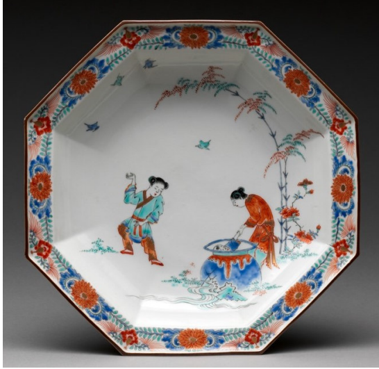
Görsel 17: Japon Kakiemon Porselen Tabak