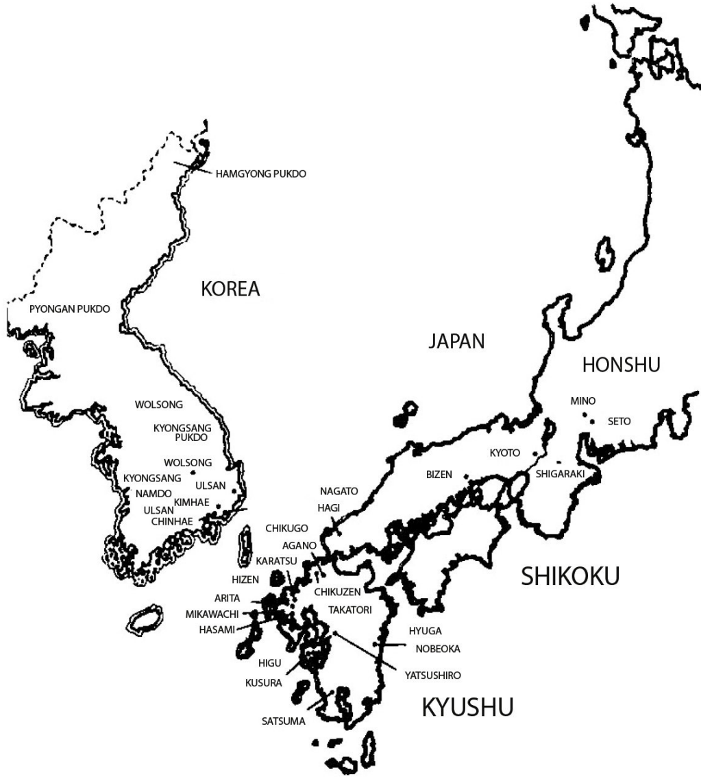
Harita 1: Kore ve Japon Seramik Üretim Merkezleri