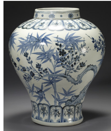
Görsel 8: 15.yy'da üretilen Mavi-Beyaz Porselen Örneği