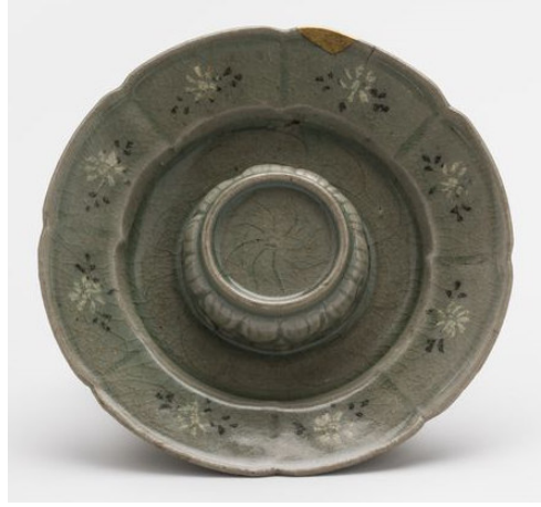
Görsel 4: Koryo Seledon Sırlı Sangam Örneği