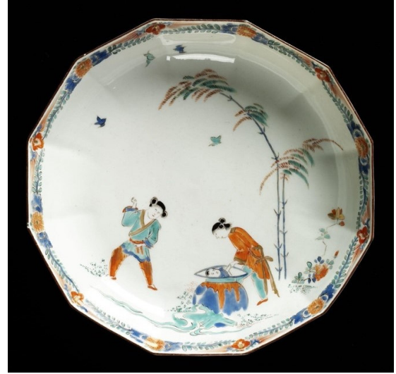
Görsel 18: Meissen Porselen Fabrikası Üretimi Kopya Tabak