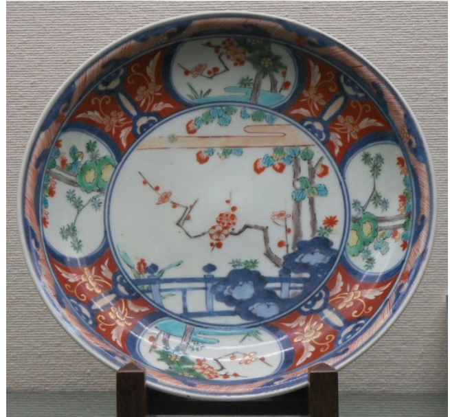
Görsel 16: Sırüstü Dekorlu Arita Porselen Tabak, 1700–1730