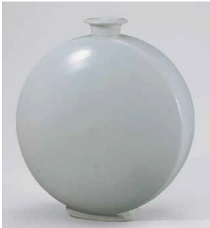
Görsel 7: 15.yy'ın başlarında üretilen Porselen Örneği

Zamanla 15. yüzyılın başlarında, düz beyaz ürünlerin yerini kobalt mavisi ile dekorlanmış porselen ürünler almıştır. 15. ve 16. yüzyıl son derece basit ama zarif formlarda tabaklar, kaseler, şişeler ve kavanozların yanı sıra özel sofrta takımları ve ayrıca tören ve hatta mezar kapları üretilmiştir (Lee, 2004).