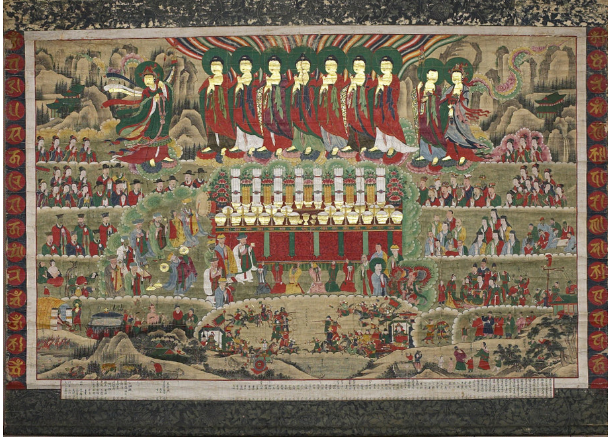
Görsel 1: 18. yüzyıl başlarında yapıldığı düşünülen resimde en alttaki üçte birlik kısımda, Imjin Savaşından kaçan kadın ve çocukların tepelerde saklandığı sahne tasvir edilmektedir.