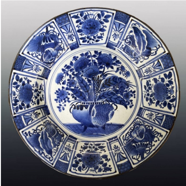
Görsel 15: Mavi-Beyaz Arita Porselen Tabak, 17. Yüzyıl.

Arita porselenin erken dönem örnekleri ağırlıklı olarak sıraltı mavi-beyaz dekorlu iken 17. yüzyıl ortalarında ise sırüstü kırmızı, sarı, yeşil ve mavi renkler eklenerek ürün çeşitliliği geliştirilir (Cooper, 2000, s. 79).