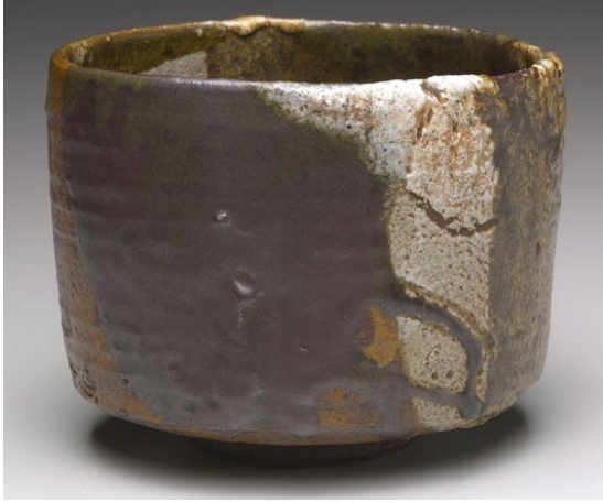
Görsel 10: Astarlı ve Sırlı Satsuma Çay Kasesi, 17.yy.