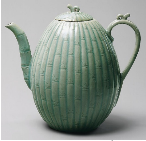
Görsel 3: Koryo Seledon Sırlı İbrik,12. yüzyıl ilk yarısı.

Özellikle Budizm'in etkisini yitirmeye başlaması, yerine Yeni Konfüçyüsçü yaklaşımın benimsenmesi ile toplumun tüm dinamiklerinde yeni arayışlar ortaya çıkmaya başlamıştır. Şüphesiz bu değişimler seramik üretimine de etkilemiştir. Joseon Hanedanlığı öncesinde hüküm süren Koryo Hanedanlığı döneminde Budizm, kraliyet ailesinin, soyluların ve üst düzey saray mensuplarının himayesinden yararlanan belirlenmiş devlet dinidir. Devlet ayinleri, muhteşem Budist tapınakları, görkemli saraylar ve konakların inşası gibi çeşitli ritüeller giderek artan mükemmel el sanatları arzını gerektirmektedir. Çin'in seramik sanatının etkili olduğu bu dönemde Koreli çömlekçiler Çinli çömlekçilerin yeni şekil, renk ve süsleme tekniklerini özümsemişler ve kendi üsluplarını bu tekniklerle birleştirerek üretimler gerçekleştirmişlerdir. Söz konusu dönemde, Çin'deki Song Hanedanlığı döneminde üretilen seledon sırlı ürünlerden esinlenen Koreli çömlekçiler, Pisaek isimli Koryo seledonlarını üretmişlerdir. Bu seledon sırlı örneklerin üzerine kakma tekniği uygulayarak Sangam isimli yeni ürünler geliştirmişlerdir (Koh, 1969, s. 150-151).