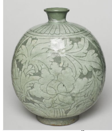
Görsel 6 Buncheong Örneği, 15.yy

Kaynak: www.brooklynmuseum.org/opencollection/objects/101615