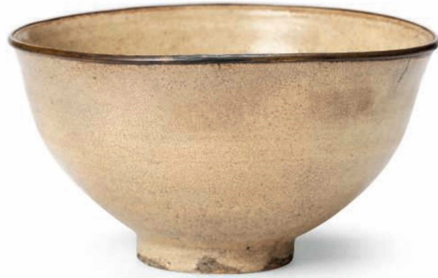
Görsel 11: Beyaz Satsuma Çay Kasesi, 17 yy.