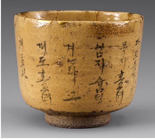
Görsel 12: Hagi Çay Kasesi, 17-18. yüzyıl.