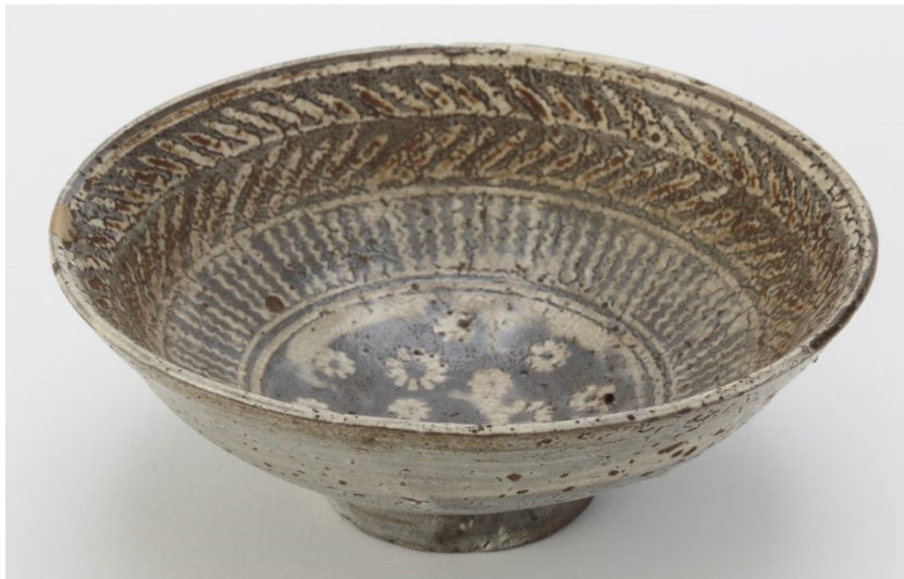
Görsel 14: Karatsu Çay Kasesi.

Karatsu bölgesine getirilen Koreli çömlekçiler, Lord Terasawa'nın himayesinde ve onun çay seremonilerinde kullanmak üzere sipariş ettiği çay kaplarını üretmişlerdir. Bu bölgede üretilen ve aynı isimle bilinen kap türleri demir içerikli koyu renk stoneware tipi killer ile üretilmiş ve çömlekçi çarkında şekillendirilmiştir. Hagi ürünlerinde olduğu gibi mishima , hakeme ve kohiki teknikleri kullanılarak dekorlanmışlardır. Feldispat ve odun külü içeren şeffaf sırlar, pirinç sapı külü içeren opak sırlar ve demir içeren sırlar kullanılmıştır. Büyük boyutlu ve geniş iç hacme sahip yaklaşık 20 odacıklı fırınlarda pişirilmiştir. Çay kapları tüm batı Japonya'nın birçok bölgesinin ve hatta Güneydoğu Asya'nın ihtiyacını karşılayacak kadar çok üretilmiştir (Crueger ve diğerleri, 2006, s. 72; Wilson, 2005, s. 162-163 ).