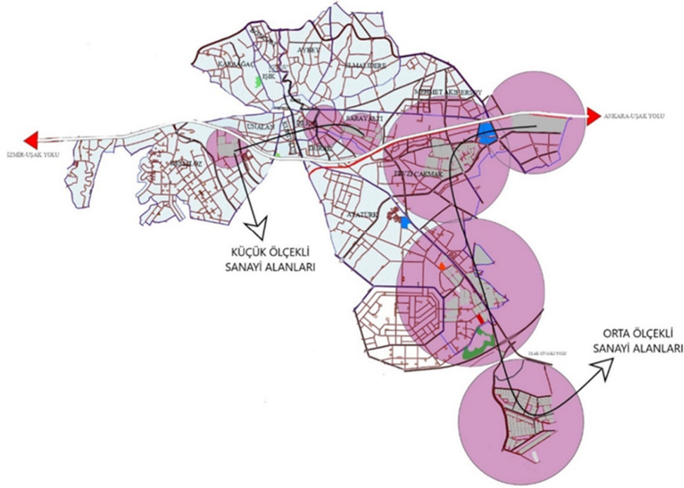
Harita 2. 1953-1990 Döneminde Uşak Kenti ve Sanayi Alanlarının Yerleşimi

1923-1953 döneminde kentin Ankara-İzmir yolunun kuzeyinde geliştiği, sanayi tesisleri yer seçiminin kentin gelişimi yönlendiren bir dinamik olduğu görülmektedir. Yeni kurulan işyerleri ile birlikte kentin gelişimi güney/güney-doğu yönünde saçaklanma şeklinde gerçekleşmiştir (Harita 1).