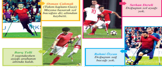
Görsel 1.14: Ampute Futbol Millî Takımımızın oyuncularından bazıları

Bazı insanların önyargılarıyla mücadele eden bedensel engelliler öyle başarılarla imza atıyorlar ki diğer engellilerin moral ve ilham kaynağı oluyorlar. Böylece kendilerini dışlayan insanların kafalarındaki engelli algısının değişmesinde önemli rol oynuyorlar. Bu konudaki en güzel örneklerden biri 2017 yılında ülkemizde yapılan Avrupa Ampute Futbol Şampiyonası'nda yaşandı. Bu şampiyonada Ampute Futbol Millî Takımımız 41 bin kişinin izlediği final maçında İngiltere'yi 2-1 yenerek Avrupa şampiyonu oldu. Şimdi bu takımın bazı oyuncularını yakından tanıyalım (Görsel 1.14).