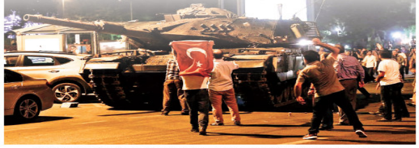
Görsel 6.18: 15 Temmuz gecesi demokrasiyi savunmak üzere sokaklara çıkan vatandaşlarımız

15 Temmuz 2016 tarihte "Demokrasi ve Millî Birlik Günü" olarak geçmiştir. Millî iradenin karşısında hiçbir gücün duramayacağını ifade eden bu günün anlam ve önemini iyi kavramalıyız. Ülkemizin bağımsızlığını ve bireysel özgürlüklerimizi 15 Temmuz'da darbecilere karşı cesaretle direnenlere borçlu olduğumuzu unutmamalıyız. Bu vesileyle demokrasi ve millî birlik uğruna canını hiçe sayan şehitlerimize ve gazilerimize şükran duymalıyız.