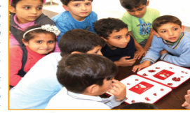
Görsel 1.13: Ülkemizde eğitim gören bir grup misafir çocuk

Konuştuğum çocuklar Türkiye'de buldukları için aslında şanslı olduklarını söyleseler de üzüntülerini gizleyemiyorlardı. Bu çok normal bir durumdur. Düşünsenize onların da bizim gibi evleri, parklarında koşup oynadıkları mahalleleri vardı. Okula geliyor, öğretmenlerini ve arkadaşlarını çok seviyorlardı. Her biri geleceğe yönelik hayaller kuruyor; öğretmen, mühendis, doktor, sanatçı olmak istiyordu. Oysa şimdi bu hayallerinin çok uzayındaydılar. Ben kendimi onların yerine koyunca içinde buldukları durumu daha iyi anlıyordum.