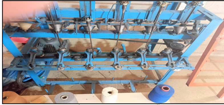
Resim 6. Atkı İpi Sarma Makinesi (Özkan, 2022)