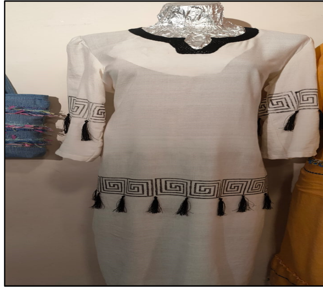
Fotoğraf 3. Ahşap Baskı Kalıp ile Yapılan Elbise Örneği (Ceylan, 2022)

Kırım Tatar Motifi: Polatlı ilçesine gelerek yerleşen Kırım Tatarları tarafında yapılan Romanya’da yaklaşık 100 yıl önce yapıldığı iddia edilen el nakışlı çevre örtüsü Polatlı bez dokuma atölyesinde dokunan kumaşlarla aplike edilerek günümüz giysilerine uyarlanıp kullanıma sunulmuştur El nakışı çevre örtüsü üzerindeki simge Kırım Tatar bayrağının üzerinde bulunan simgeye benzerliği ile de dikkat çekmektedir(Özkan Emine, Sözlü Görüşme, 10.06.2022, Polatlı).