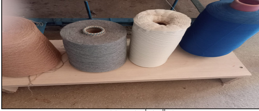
Resim 9. Pamuklu Atkı İpi (Özkan, 2022)