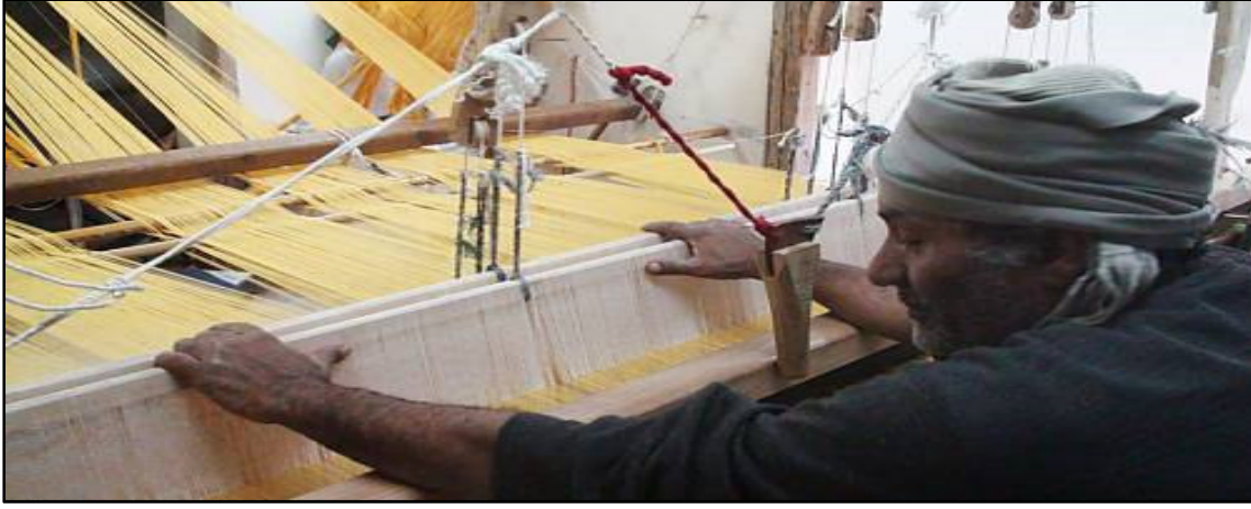
Resim 1. Yukarı Mısır'da El Yapımı Dokuma (Sa'eed).

Acil Korunmaya Muhtaç Somut Olmayan Kültürel Miras Listesi'ne alınan Mısır ülkesinin “Yukarı Mısır'da El Yapımı Dokuma (Sa'eed)” zanaat geleneği nasıl yapıldığına dair bazı örnekler Resim (1) ve (2)'de sunulmuştur.