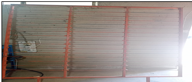
Resim 8. Duvar Çözü Aparat (Özkan, 2022)