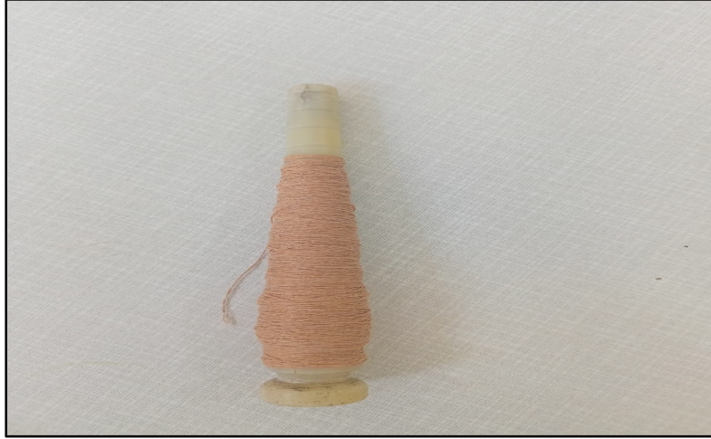
Resim 5. Masura (Özkan, 2022)