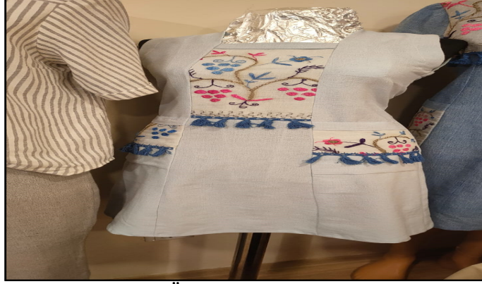
Fotoğraf 6. Kırım Tatar Motifi Yansıma Örneği ile Yapılan Bez Dokuma Elbise Örneği 2 (Ceylan, 2022)

Bu çalışmalar haricinden dokuma tezgâhlarında ayrıca 30 yıl önce yapılan tığ oylarını bez dokuma kumaşla dokuyarak yöresel günlük elbiseler tasarlanmakta, 40 yıl önce yapılan kanaviçe işlemlerini runır olarak bez dokuma kumaşa applike ederek çalışmalar da yapılmaktadır (Özkan Emine, Sözlü Görüşme, 10.06.2022, Polatlı).