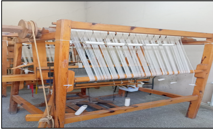
Resim 3. Tezgah (Özkan, 2022)

Bez dokuma yapımı için kullanılan ana malzemeler tezgâh, ip sarma makine ve çözücü aparatıdır. Bunun dışında kalan malzemeler ise yardımcı malzemelerdir. Polatlı Halk Eğitimi Merkezi'nde bez dokuma yapımı için kullanılan malzemeler ait görseller Resim (3), (4), (5), (6), (7), (8) ve (9)'da sunulmuştur.