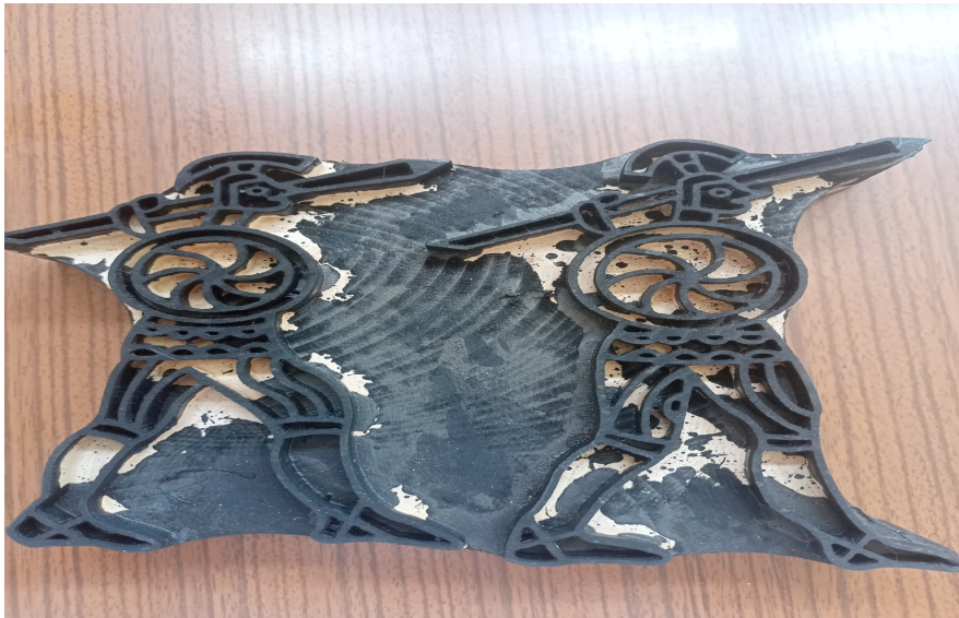
Resim 10. Frig Askeri Ahşap Baskı (Özkan, 2022)

Bez dokuma sanatından kullanılmak üzere yaptırılan ahşap baskı kalıplarının örnekleri Resim (10) ve (11)' de gösterilmiştir.