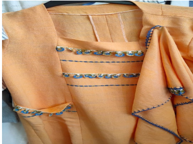
Resim 14. Kanaviçe ve Tığ Oya ile İşlemeli Bez Dokuma Örneği 2 (Özkan, 2022)