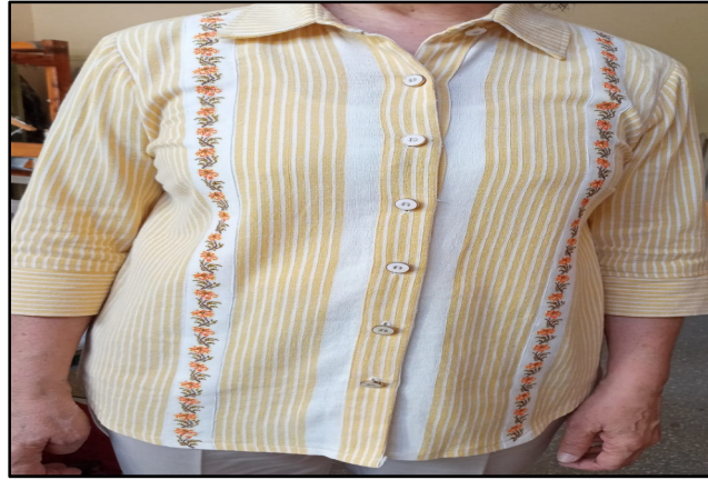
Resim 13. Kanaviçe ve Tığ Oya ile İşlemeli Bez Dokuma Örneği 1 (Özkan, 2022)

Bu çalışmalar haricinden dokuma tezgâhlarında ayrıca 30 yıl önce yapılan tığ oylarını bez dokuma kumaşla dokuyarak yöresel günlük elbiseler tasarlanmakta, 40 yıl önce yapılan kanaviçe işlemlerini runır olarak bez dokuma kumaşa applike ederek çalışmalar da yapılmaktadır (Özkan Emine, Sözlü Görüşme, 10.06.2022, Polatlı).