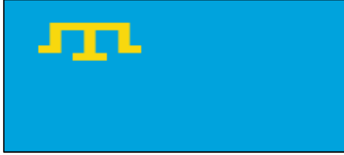
Resim 12. Kırım Tatar Bayrağı