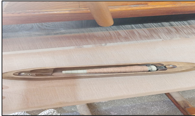
Resim 4. Mekik (Özkan, 2022)