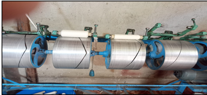
Resim 7. Çözü İpi Sarma Makinesi (Özkan, 2022)