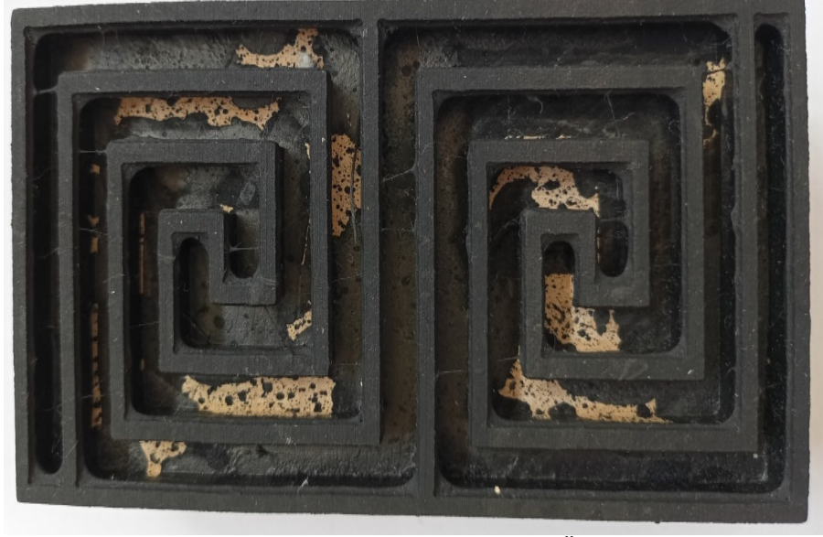
Resim 11. Frig Bordur Ahşap Baskı (Özkan, 2022)

Ahşap baskı kalıplarının kullanıldığı bez dokuma çalışma örnekleri Fotoğraf (1), (2) ve (3)' de gösterilmiştir.