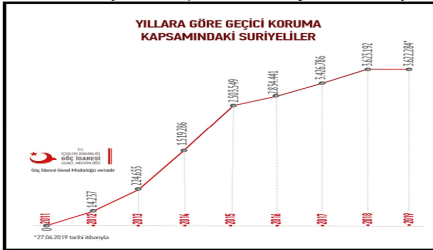
Grafik 1: Türkiye'deki Geçici Koruma Kapsamında Suriyeliler