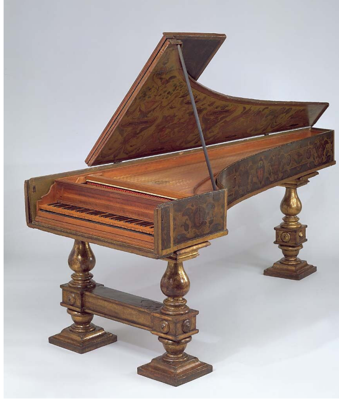
Resim 1 – Cristofori Tarafından İlk Geliştirilen Piyano

Piyano'nun güncel olarak gelişiminden bu yana ilgi çekmesi ve profesyonel ya da hobi amaçlı eğitimsel bakış açısı tek temel üzerinde düşünüldüğünde farklı metotların kullanılmasının da zorunluluğunu beraberinde getirmektedir. Profesyonel eğitimde piyanoya yaklaşım, duruş (postür) ve öğrencinin isteği doğrultusunda ona bir yol çizmek amacı ile çeşitli piyano metotlarının kullanımı gereklidir ve bu metotların öğrencinin solfej bilgisine göre başlangıç metotlarının seçimi oldukça önem arz etmektedir. Hobi eğitiminde ise öğrencinin kulağına daha çok hitap eden fakat bununla birlikte çalma tekniğini geliştirmeyi hedefleyen metotların kullanılması da gerekmektedir.