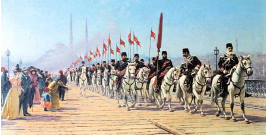
Resim 4: “Ertuğrul Süvari Alayının Galata Köprüsü’nden Geçişi” TüY 117x202 cm. TBMM Milli Saraylar Koleksiyonu İstanbul.

1901 yılında yapılan bu tabloda, II. Abdülhamid olan padişah alaydaki bütün atların beyaz renkte olmasını ister. Dolmabahçe Sarayı koleksiyonunda bulunan tabloda, Sultan Abdülhamid’in hassa alayı, tören düzeninde Galata Köprüsü’nden geçerken betimlenmiştir. Görüş alanını genişletmek amacıyla derin bir perspektifin hakim olduğu kompozisyonda, arka plandaki Yeni Cami’nin silikleşen silüeti içinden tümü beyaz, bakımlı atları, açılmış flamarıyla resmedilmiştir.