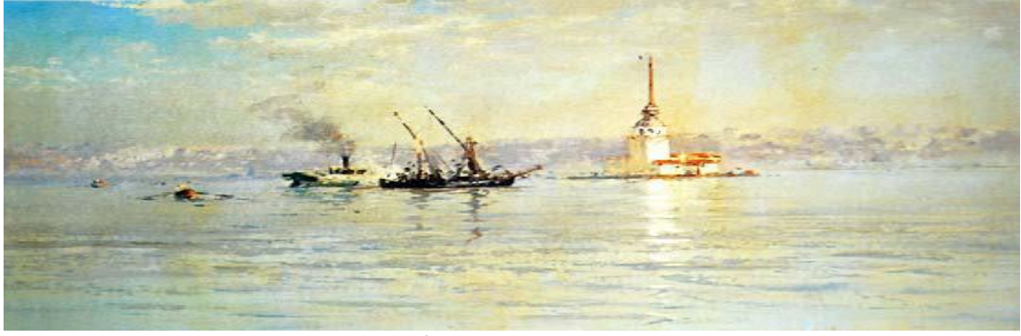
Resim 12: “Kız Kulesi”, İstanbul 1891-1910, t.ü.y.b. , 31x54cm.

“Kız Kulesi” (Resim12) isimli tablo da güneşli bir havanın atmosferi ile renklendirilen ve kulenin sudaki aksi ile boğazdaki seyir halindeki gemilerle, dumanları ile hareketlilik verilmiştir. İstanbul silüetinin geri planı oluşturduğu tablo da İstanbul’un önemli simgelerinden biri olan Kız Kulesi’ni ve su üstündeki yaşamı bizlere anlatmıştır. Küçük bir kayıkta kürek çekenlerin varlığı taşıma araçlarının da gemilerle birlikte varlığını sürdürdüğüne işaretir.