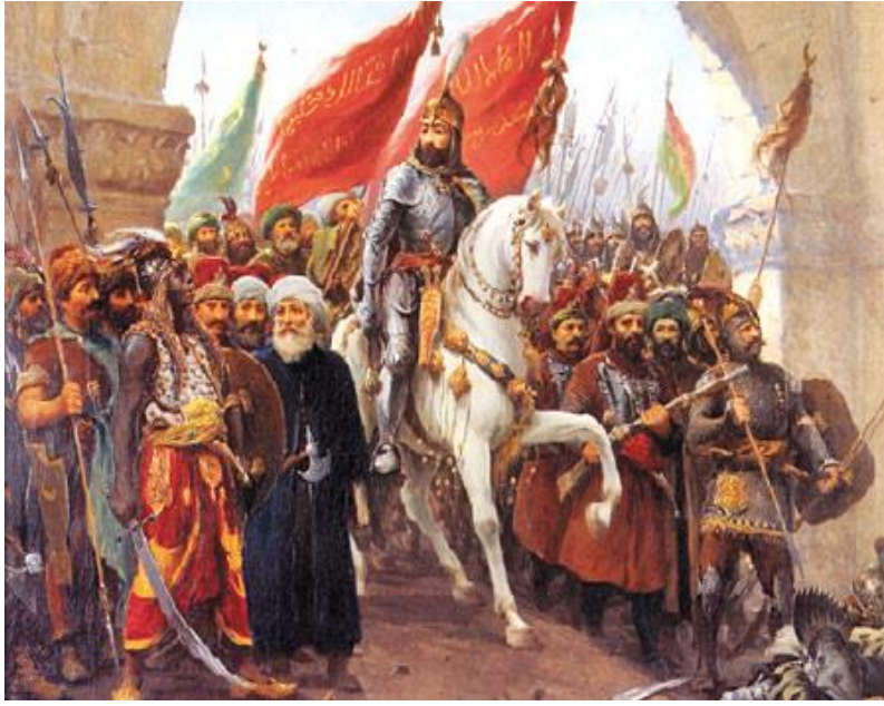
Resim 2: “Fatih Sultan Mehmet’in İstanbul’a Girişi” TÜY 98x75.5 cm. Dolmabahçe Sarayı Müzesi İstanbul.

Sultan II. Abdülhamid, Zonaro’dan Fatih Sultan Mehmed ile ilgili resimler yapmasını ister. Tabloyu yapan Zonaro, yukarıdaki resmin padişaha sunulmasını şöyle anlatır: “Tabloyu padişaha Arif Bey gösterir ve kısa bir süre sonra, soluk soluğa ve titreyerek dışarı çıkar: