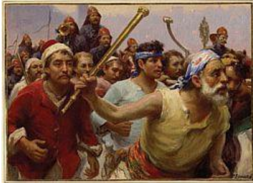
Resim 10: “Tulumbacılar(Yangın Var), Pastel 131x208 cm. Axa-Oyak Koleksiyonu İstanbul.

Tablo da Galata Köprüsünden Galata yönüne koşan tulumbacılar görülmektedir. Zonaro aynı konuyu küçük değişikliklerle birkaç kez daha çalışmıştır. Tablo da köprü üstünde koşan tulumbacıların arkasında ilk kez 1874 yılında kurulan İtfaiye alayı'nın itfaiyecileri, yeni kıyafetleriyle dikkati çekerler. Resimde sol tarafta Zonaro ve eşi de olayı izlemektedirler (Germaner vd 2002:251).