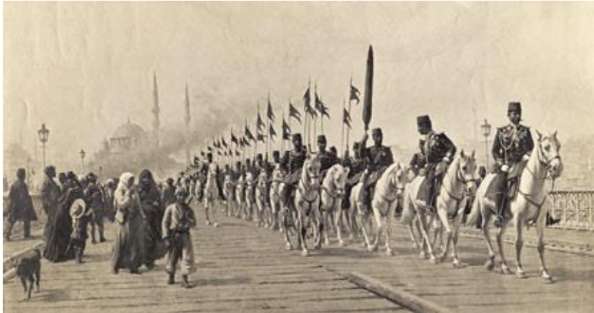
Resim 3: “Ertuğrul Süvari Alayının Galata Köprüsü’nden Geçişi” 77x145 cm. Suna-İnan Kıraç Koleksiyonu İstanbul.

Fausto Zonaro'nun 1901 yılına tarihlenen "Ertuğrul Süvari Alayı'nın Galata Köprüsünden Geçişi"ni (Resim3-4),betimleyen resmi, bir askeri tören resmi olmasının yanı sıra, aynı zamanda bir güncel yaşantı sahnesidir ve kompozisyon düzeni fotoğraftan yararlandığını açıkça ortaya koymaktadır.