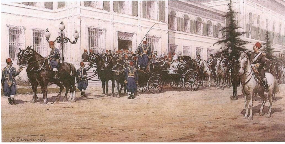
Resim 6: "Kaiser Wilhem ve Eşi Yıldız'da", 1899. Suluboya, 43x76 cm. Dolmabahçe Sarayı Müzesi İstanbul.

İstanbul'a 1889, 1898 ve 1917de olmak üzere üç defa gelmiş ve Yıldız Şale Köşkü'nde ağırlanmış olan Alman İmparatoru Kaiser II. Wilhelm ve eşi Augusta Victoria'ya ait resimler, Osmanlı sultanını ziyarete gelen Avrupalı hanedan mensuplarını konu alan çalışmalardandır. Zonaro'nun İmparator, imparatoriçe ve maiyetlerindeki saltanat kayığına binmek üzere Dolmabahçe Sarayı'nın deniz kapısından çıkarken gösteren kompozisyonun da (Resim5), rıhtıma yanaşmış altın oymalarla süslü saltanat kayıkları yer almaktadır. Kürekçiler ünlü misafirlerin binmesini beklerken, ellerindeki kancalı sopalarla kayıkları akıntıya karşı rıhtımda tutmaya çalışmaktadırlar. İmparatorun bineceği kayığın burnunda, Devlet-i Osmani'nin simgesi kanatlarını açmış altın bir şahin bulunmaktadır. Kürekçiler beyaz bürümcük gömlek ve püsküllü kırmızı fes giymişlerdir. Dolmabahçe Camisi'nin yer aldığı bir İstanbul manzarası geri planı oluşturmaktadır.