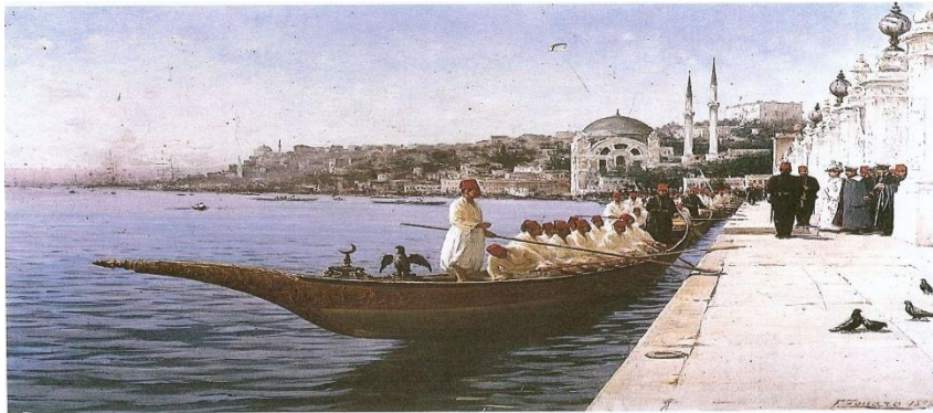
Resim 5: “Dolmabahçe Sarayı Rıhtımında Kaiser II. Wilhem”, 1898, TüY 77X110 cm. Dolmabahçe Sarayı Müzesi, İstanbul.

Ertesi gün padişah hazretlerinin Fransız Meclis Başkanına armağan ettiği tablo, Fransa Büyükelçiliği’ne gönderilir. Sarayda duvarda boş kalan yeri doldurmak üzere Sultan Abdülhamid aynı tablonun yeniden yapılmasını talep eder, (bu ikinci tablo bugün Dolmabahçe Sarayı’nda sergilenmektedir) Zonaro bir süre sonra Ertuğrul Süvari Alayı Köprü’de adlı eseri tekrar yapar. Ancak bir takım değişikliklerle... Resmin ilk halinde alayın geçişini izleyen yalın ayaklı bir çocuk ve çingeneler bu kez bu tabloda yoktur. Onların yerinde ise, gayet iyi giyimli İstanbullularla, Zonaro ve eşi yer alır. Belli ki Münir Paşa’nın önceden yaptığı uyarı etkili olmuştur (Zonaro 2008:145).