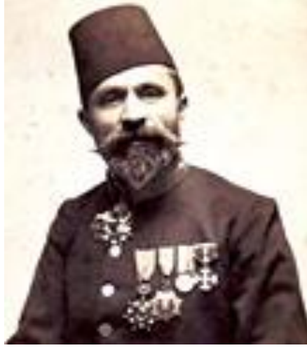
Resim 1: Fausto ZONARO (1854-1929)

Fausto Zonaro (Resim:1), 18 Eylül 1854 yılında İtalya'da Padova eyaletinin Masi kasabasında dünyaya gelmiştir. Uzun yıllar İtalya'da resim eğitimi alıp çalıştıktan sonra 1891 yılında 37 yaşındayken tanınmış yazarlar Edmondo de Amicis ve Theophile Gautier'in İstanbul üzerine yazdıkları kitaplardan esinlenerek İstanbul'a gitmek, orada yaşamak ve sanatını sürdürmek kendisi için tutkulu bir düş haline gelmiştir. 1874 yılında İstanbul'a gelen İtalyan yazar Edmondo Amicis yazdığı Constantinopoli (İstanbul) adlı kitabında İstanbul'dan övgüyle bahsetmiş, İslam kültürünün damgasını vurduğu toplumsal hayata vurgu yapmıştır. Bu gizemli şehri merak eden Zonaro, 9 günlük bir gemi yolculuğunun ardından 1891 yılında İstanbul'a gelir (Öndeş vd.2002:28). Zonaro, İstanbul'da yaşadığı ilk olayı asla unutamamıştır: