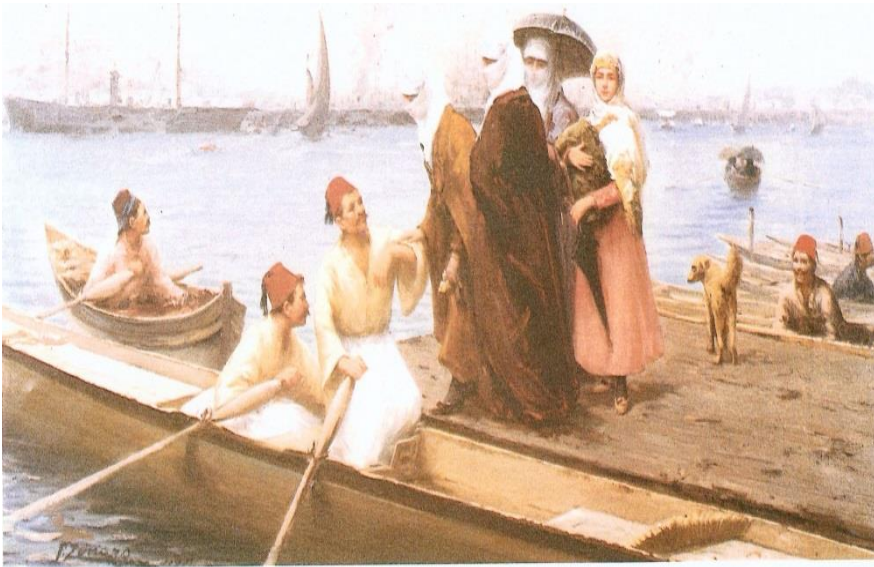
Resim 9: “Kayığa Binen Kadınlar” TÜY 56x83 cm Dolmabahçe Sarayı Müzesi, İstanbul.

Sanatçının “Bayram” (Resim8) isimli tablosunda ülke insanın gelenekleri, ülkeye yabancı olanlar için değerli belgeler olabilen giysiler, renkler ve çizgilerden oluşan hızlı izlenimlerle verilmiştir; Sanatçının geniş hayal gücüyle Doğu hayatının en ince ayrıntısına kadar betimlemiştir. Bir açık hava ressamı olan Zonaro'nun sıcak bir havada, sıcak renklerden oluşturduğu tablo da arka fonda kullanılan bina görüntüleri bizlere şehir mimarisinin dokusu hakkında bilgi vermektedir. Her resminde olduğu gibi İstanbul'un kosmopolitik halk yapısını belirtmek amacıyla farklı milletlere ait insan figürlerini de işlemeyi unutmamıştır.