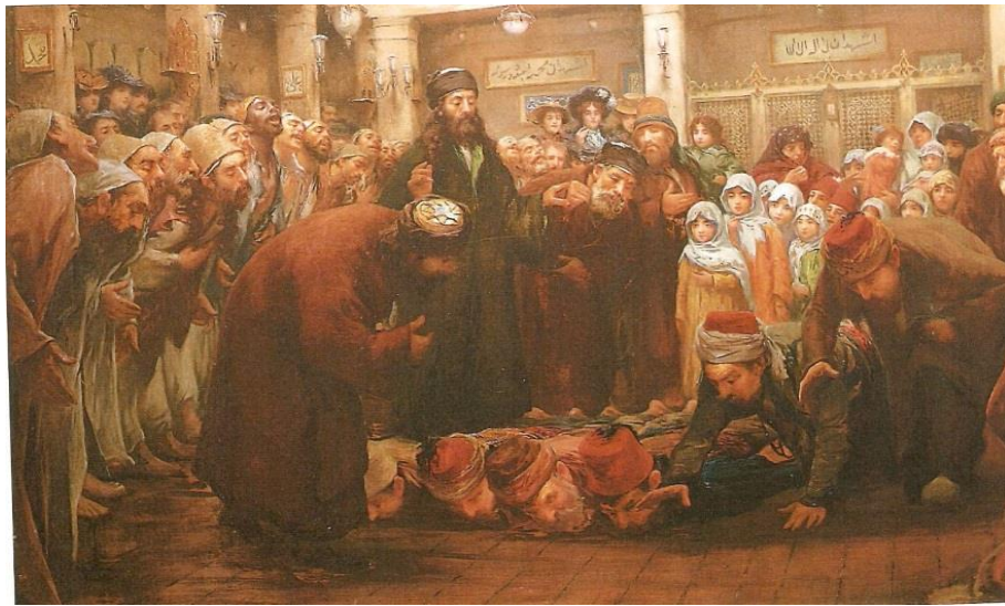
Resim 6: "Rufai Dervişleri" 1910 TUY 100x201.3 cm. Christie's, Londra.

Kaiser ve eşini Yıldız Şale Köşkü'nün önünde dört atlı arabanın içinde gösteren suluboya (Resim6) ise, daha çok renklendirilmiş bir fotoğraf etkisi yapmaktadır. Geri plandaki köşkün kompozisyon içinde kesik olarak gösterilmesi ve bakış açısının genişliği, bu düşünceyi destekler niteliktedir. Her iki resimde de kullanılan perspektif, sanatçının fotoğraftan yararlandığını ortaya koymaktadır. İmparator ve İmparatoriçe, İstanbul'da görülecek yerlere götürülerek ağırlanmışlar ve çeşitli fotoğrafları çekilmiştir. Saray ressamı Zonaro'dan, bunlardan seçilen bazı örneklerini büyütülerek renklendirilmesinin istendiği anlaşılmaktadır. (Germaner 2002:147).