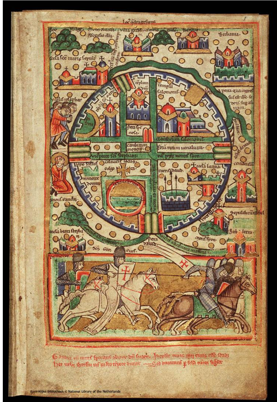
Figure 4 Lahey Haritası ( https://tr.topwar.ru/96995-ischeznuvshee-zoloto-ordena-tamplierov.html )

Kubbetü's Sahra'nın (Rab'bin Tapınağı) bitişğinde, Haçlılar Dönemi'nde Tapınak Şövalyeleri'nin konutu olarak kullanılan "Süleyman Tapınağı" yani El Aksa Cami (Templum Salomonis) görülmektedir (Tishby, 2001). Üst yarımın solunda yer alan ve sur içinde bulunan son yapı ise St. Anne Kilisesi'dir. Lahey Haritası ve Brüksel Haritasında St. Anne Kilisesi'nin yanında, surlara bitişik Koyun Havuzu yer almaktadır.