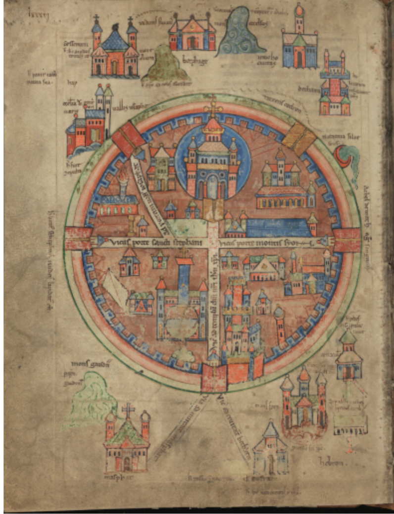
Figure 3 Uppsala Haritası ( https://www.alvin-portal.org/alvin/attachment/document/alvin-record:85374/ATTACHMENT-0003.pdf )

Lahey Haçlı Haritasında Davud Kalesi, mazgalı surların arasından yükselen üç mızrakla daha net bir şekilde tanımlanmıştır (Bkz. Figure 4) (Goldhill, 2009). Davud Kalesi'nin sağında ise (Kentin güneyi) Zion/Sion Kapısı yakınında Latin Kilisesi bulunmaktadır. Davud Kapısının sol tarafında ise Kutsal Kabir Kilisesi (Sanctum Sepulchrum) yer almaktadır. Üç haritada da daire formunda tasvir edilen Kutsal Kabir Kilisesi'nin Uppsala Haritasında etrafında kuleler yer almaktadır (Bkz. Figure 3).