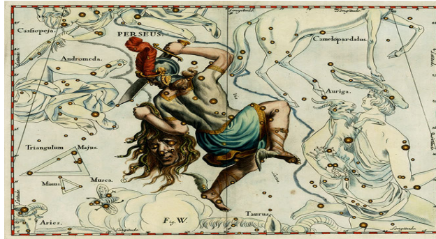
Resim 3: Perseus Takımyıldızı