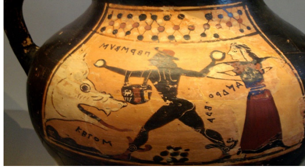
Resim 2: Ketos (Cetus), Perseus ve Andromeda